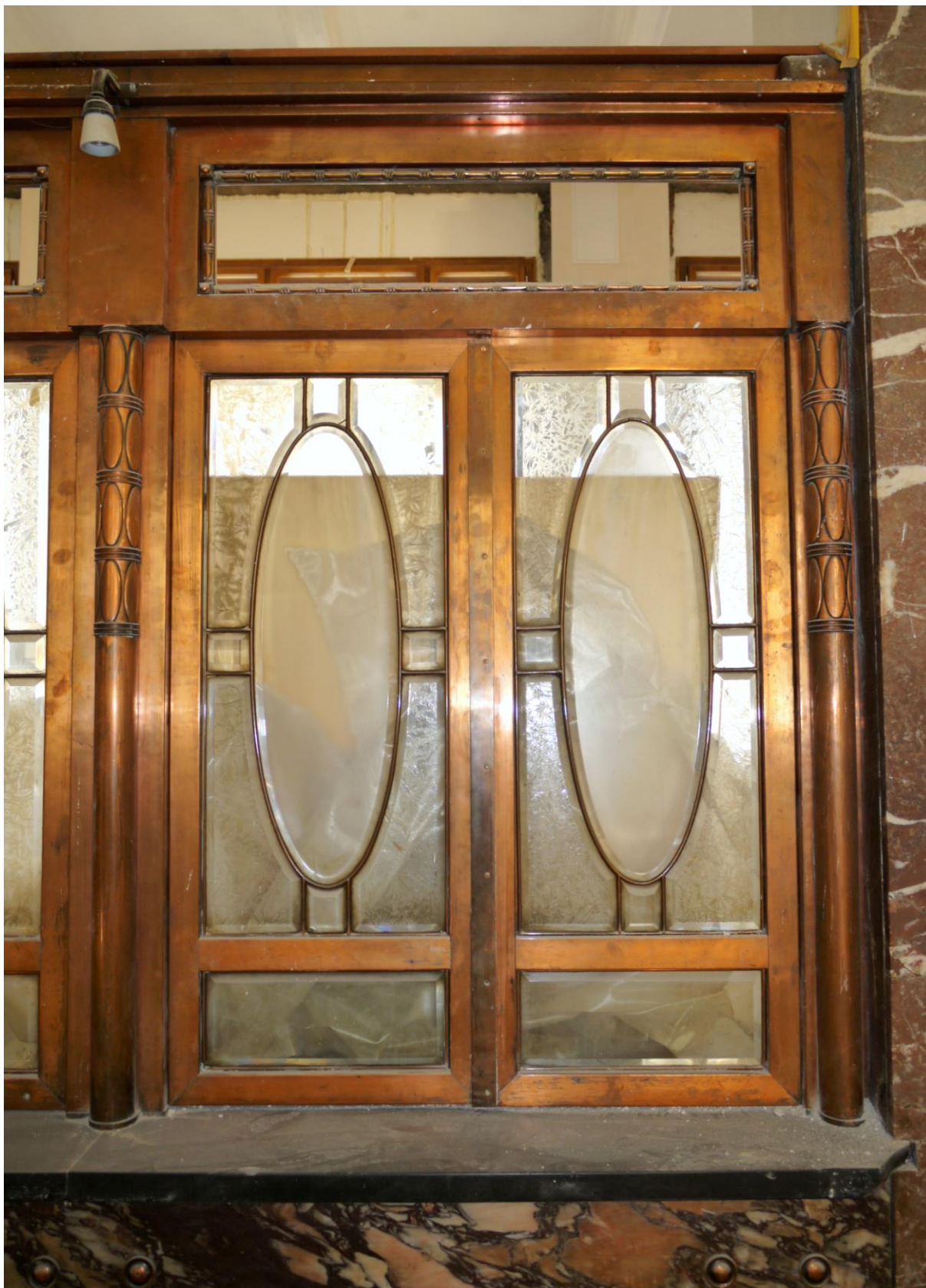
Obr. č. 12. Stav při průzkumu - bankovní přepážka /levá/ - detail Na snímcích je 1/3 vnější strany přepážky. Konstrukce i dvířka jsou potažena v celé ploše měděným plechem. Měděné prvky musí restaurovat odborník s příslušnou licenci MK ČR.