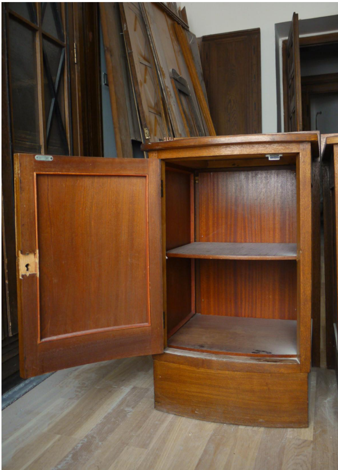
Obr. č. 6. Stav při průzkumu – skříňka /stolek/ - celkový pohled Oba stolky jsou shodné konstrukce i výzdoby. Povrch je silně znečištěný, včetně vnitřních ploch dýhovaných mahagonem. Hrany jsou odřené, často je dýha na rozích oštipaná. Dvířka jsou bez zámků a jsou dodatečně opatřena mosaznými knopkami. V zavřené poloze drží dvířka novodobý magnet. Skříňky jsou opatřeny jednou policí.