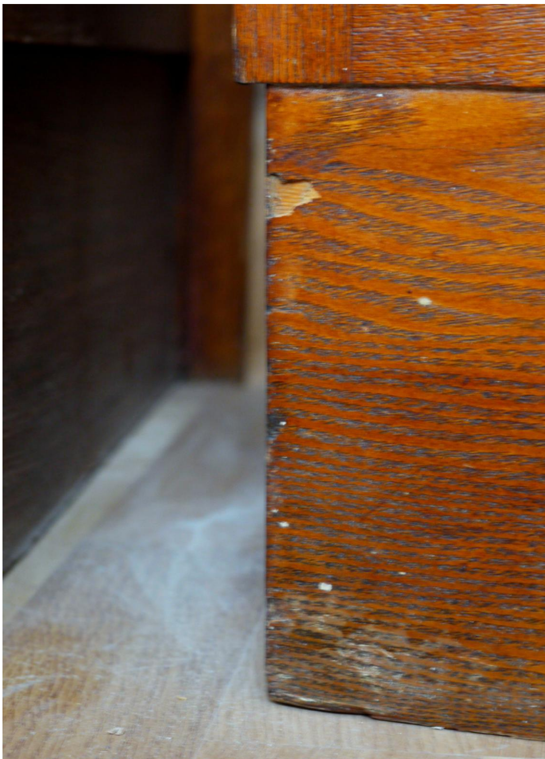
Obr. č. 7. Stav při průzkumu – skříňka /stolek/ - celkový pohled Oba stolky jsou shodné konstrukce i výzdoby. Povrch je silně znečištěný, včetně vnitřních ploch dýhovaných mahagonem. Hrany jsou odřené, často je dýha na rozích oštípaná. Dvířka jsou bez zámků a jsou dodatečně opatřena mosaznými knopkami. V zavřené poloze drží dvířka novodobý magnet. Skřínky jsou opatřeny jednou policí.