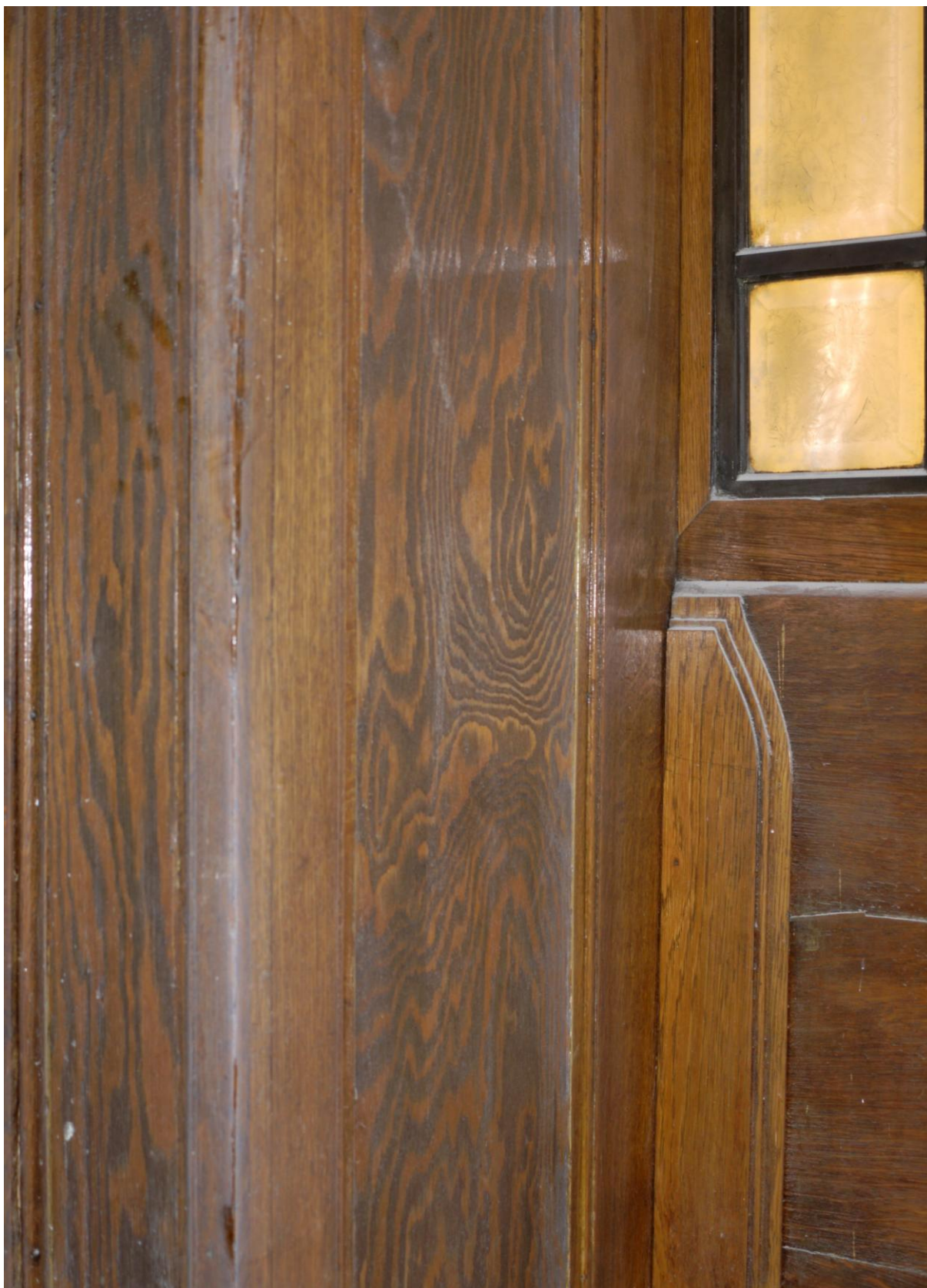
Obr. č. 3. Stav při průzkumu – lavička – detail

Na obou stranách navazujícího obkladu je do výplně vsazena borová překližka. Překližku by bylo vhodné nahradit materiálem s dubovou dýhou.