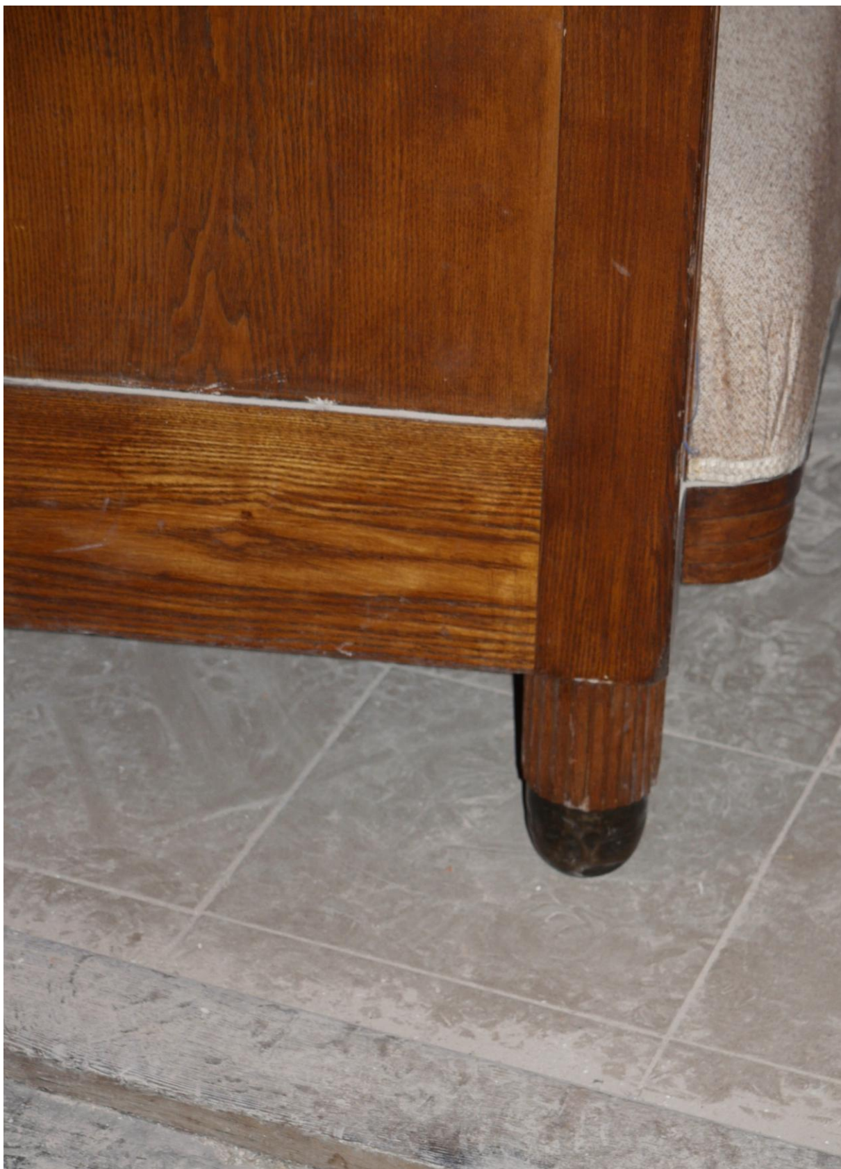
Obr. č. 2. Stav při průzkumu – pohovka - detail Na snímku je detail nohy pohovky. Pohovka má na nohou mosazné návleky. Mosaz je zčernalá a velmi zoxidovaná. Povrch je silně znečištěný, hrany jsou odřené. Čalounění je u konstrukce začištěné lemovkou.