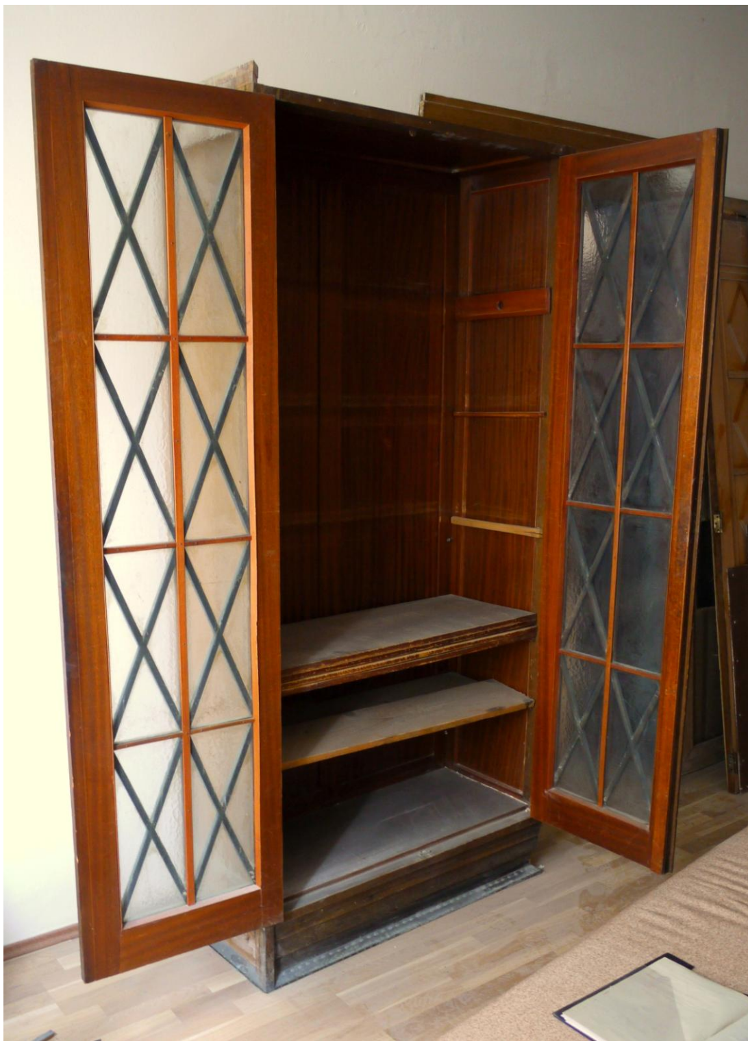
Obr. č. 2. Stav při průzkumu - skříň - celkový pohled Na snímku je pravá polovina skříně v otevřeném stavu. Skříň byla původně řešena jako šatník s jednou policí nad nosnou tyčí ramínek. Ostatní police jsou vloženy dodatečně, bez možnosti změny výšky police. Vnitřní plochy skříně jsou dýhované mahagonem.