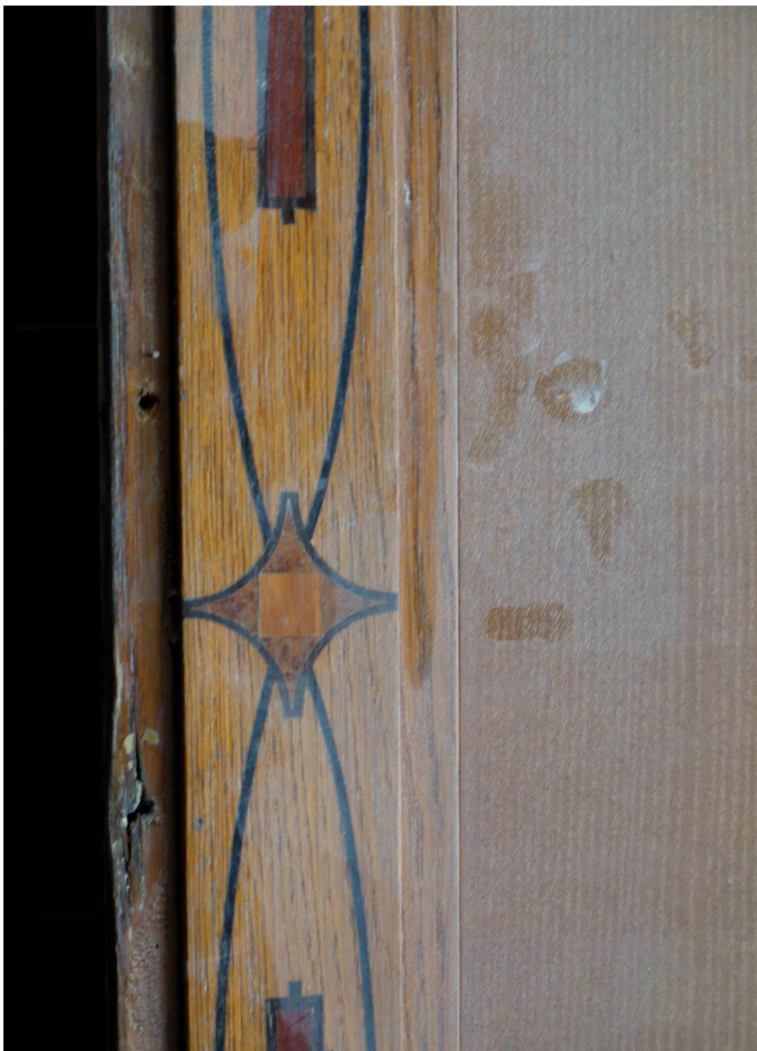
Obr. č. 9. Stav při průzkumu – obklad - detail

Na snímku je horní část obložení z východní stěny prostoru 507. Část poškození byla způsobena při demontáži, část již v minulosti. Obklad byl upevněn na levé straně zasunutím za skříň a přišroubován ze zadní strany. Použití vrutů ze zadní strany již nebude možné.