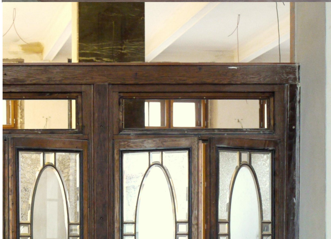
Obr. č. 13+14. Stav při průzkumu - bankovní přepážka /pravá/ - celek +detail Na snímku č. 13 je druhá přepážka. Její stav je v podstatě shodný. U horních okének na vnitřní straně chybí takřka všechny černě lakované lišty.