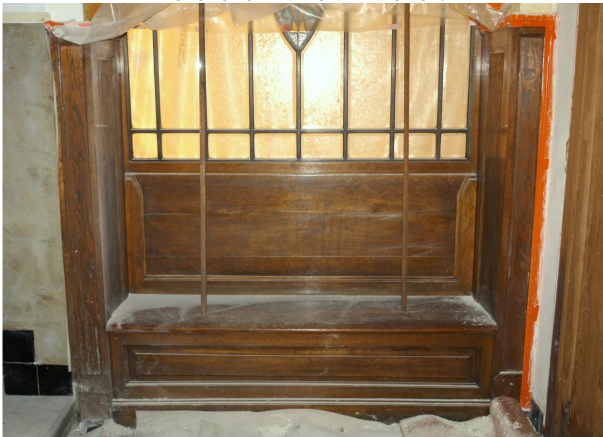
Obr. č. 1. Stav při průzkumu – lavička – celkový pohled

Na snímku je lavička na kterou navazuje rám s vitráží. Lavička má rozeschlý opěrák, který je sklížený ze tří částí. Lavice byla nevhodně opravována. Větší poškození jsou zejména u země, kde chybí části soklu.