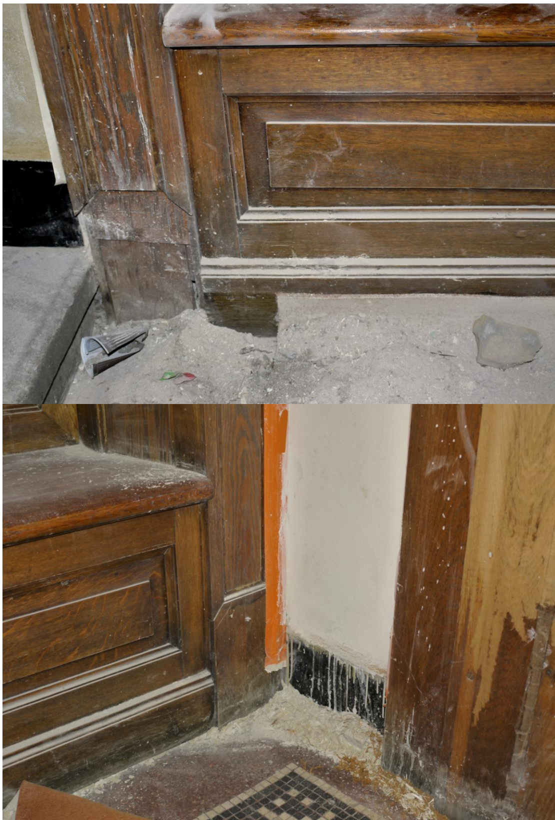
Obr. č. 4+5. Stav při průzkumu – lavička – detail Na obou stranách navazujícího obkladu jsou poškozeny spodní části. Oprava je rovněž provedena překližkou. Chybějící části je nutné doplnit podle původního řešení.