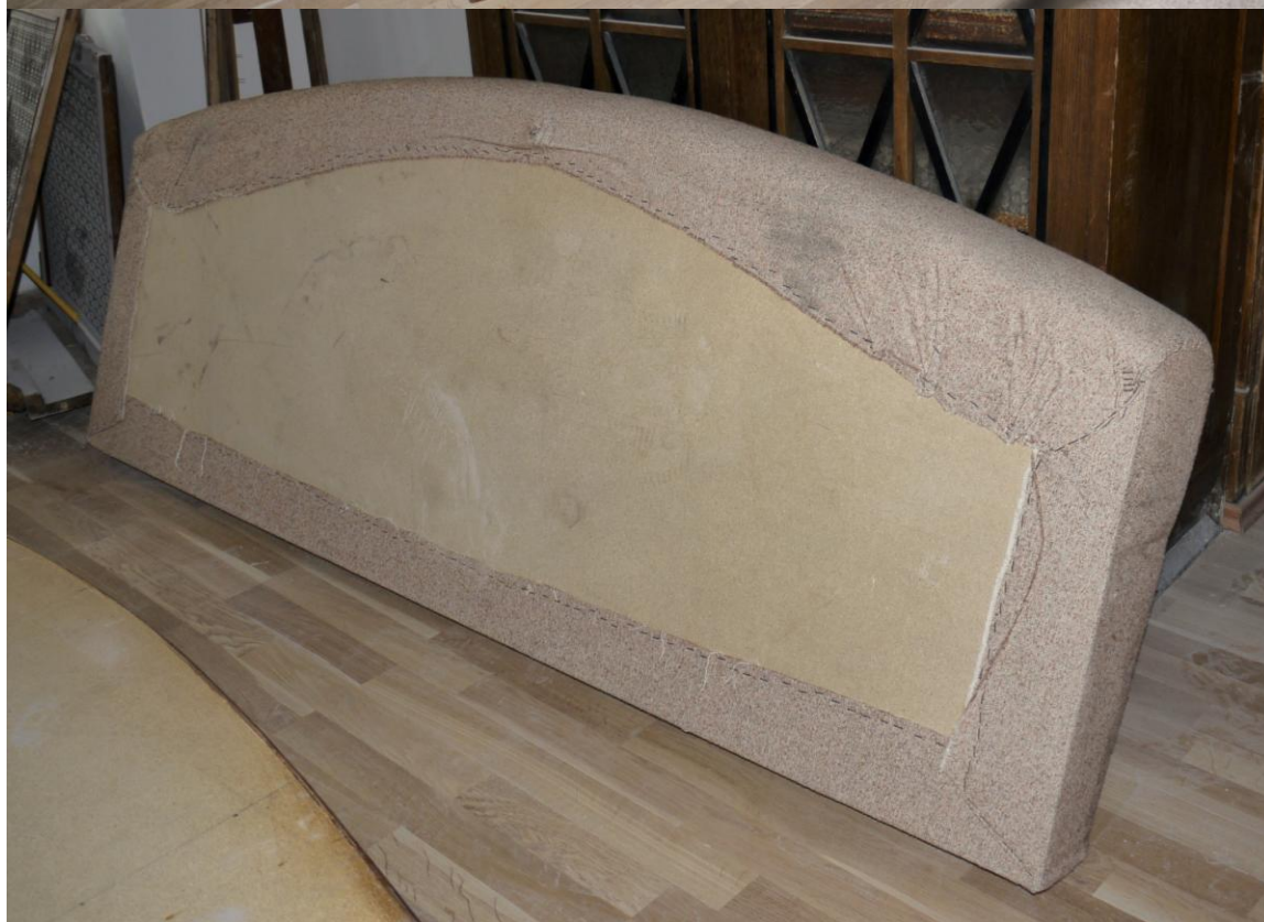
Obr. č. 1+2. Stav při průzkumu - pohovka - celkový pohled Povrch je silně znečištěný. Spodní část včetně čalouněného sedáku není původní. Podstavec je vyrobený z borové překližky a dřevotřísky. Samostatný sedák je čalouněný na dřevotřískové desce.