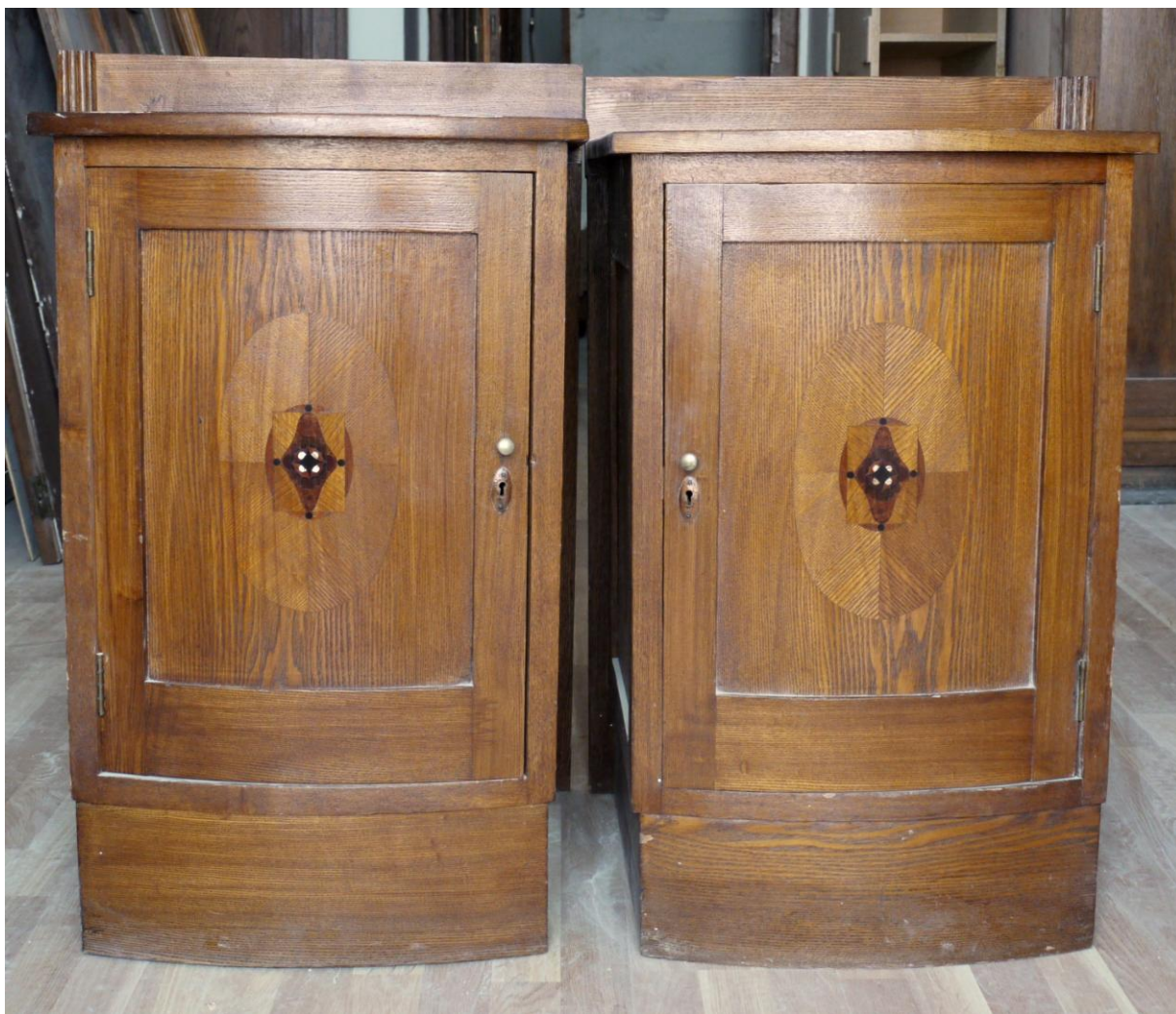
Obr. č. 5. Stav při průzkumu – skříňky /stolky/ - celkový pohled Na snímku jsou postraní stolky. Povrch je silně znečištěný, hrany jsou odřené, často je dýha na rozích oštípaná. Dvířka jsou bez zámků a jsou dodatečně opatřena mosaznými knopkami.