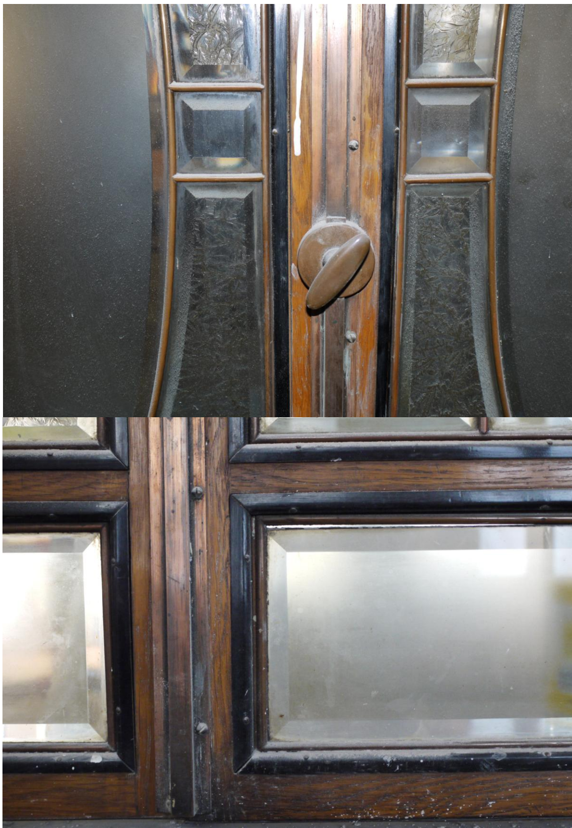
Obr. č. 6+7. Stav při průzkumu - bankovní přepážka /levá/ - detail Na snímku č. 6 je vidět vnitřní strana dvířek přepážky. Dubová dvířka jsou na vnější straně potažená měděným plechem, na vnitřní straně jsou s měděným kováním. Zasklení je zalištováno černě lakovanými lištami. Část lišt chybí.