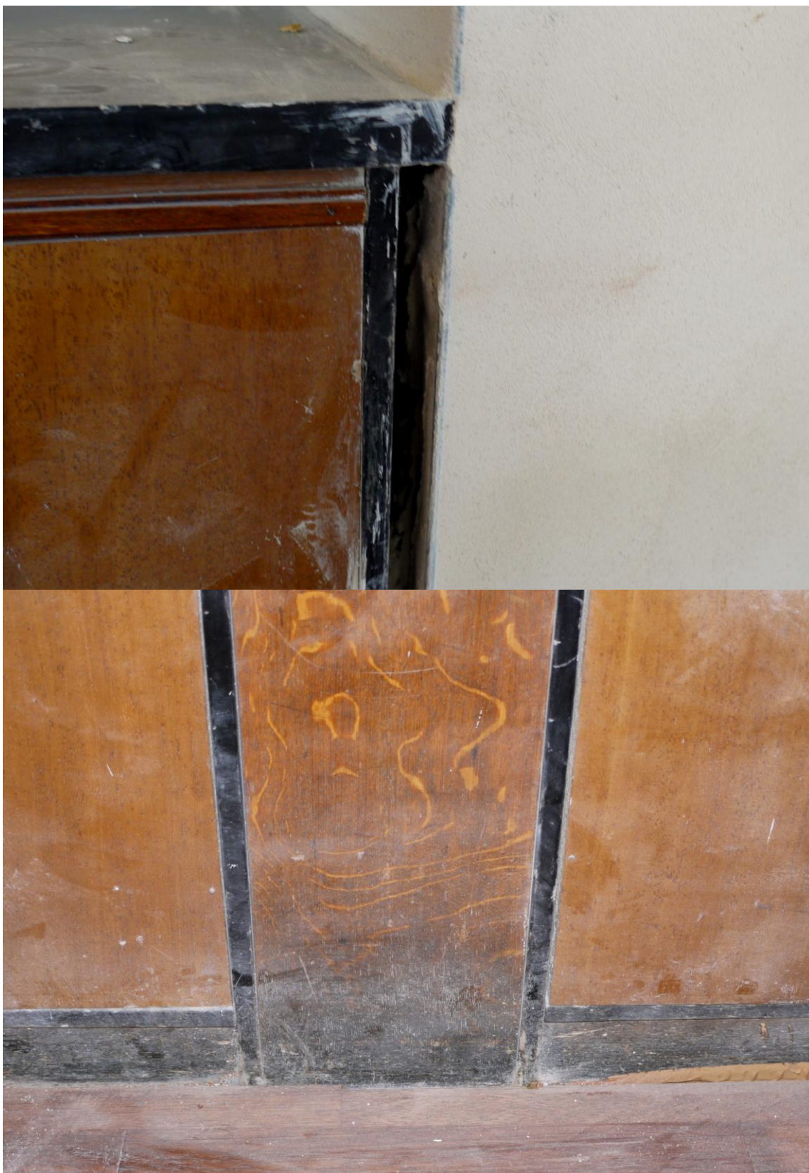
Obr. č. 16+17. Stav při průzkumu - bankovní přepážka /pravá/ - detail Na snímku je ukázán stav po stavebních pracích. Povrch je znečištěný, bude nutné vyřešit začistění styku mezi přepážkou a stěnou a to na obou dílech přepážky /horní i dolní část/. Dobře patrném zčernání soklu u spodní skříňky.