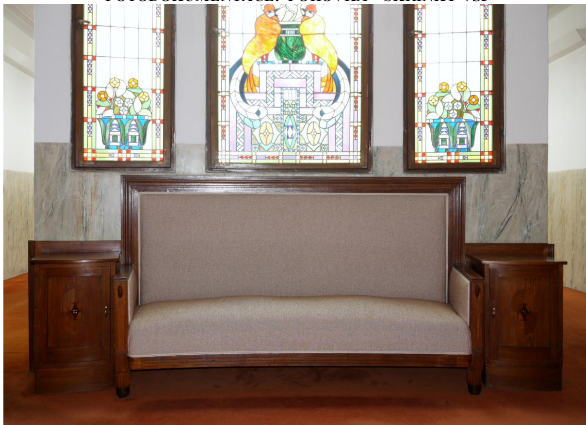
Obr. č. 1. Stav při průzkumu – pohovka se stolky - celkový pohled

Na snímku je vidět společná sestava složená ze tří kusů. Sedák pohovky není rovný, což by mohlo naznačovat problémy v základu čalounění /popraskané vyvázání, uvolněná péra apod. Povrchy jsou silně znečištěné, laky jsou ztmavlé. Dýha na stolcích je poškozená, hrany jsou odřené. Podrobnosti viz detaily. Pohovka má na nohou mosazné návleky. Mosaz je zčernalá a velmi zoxidovaná.