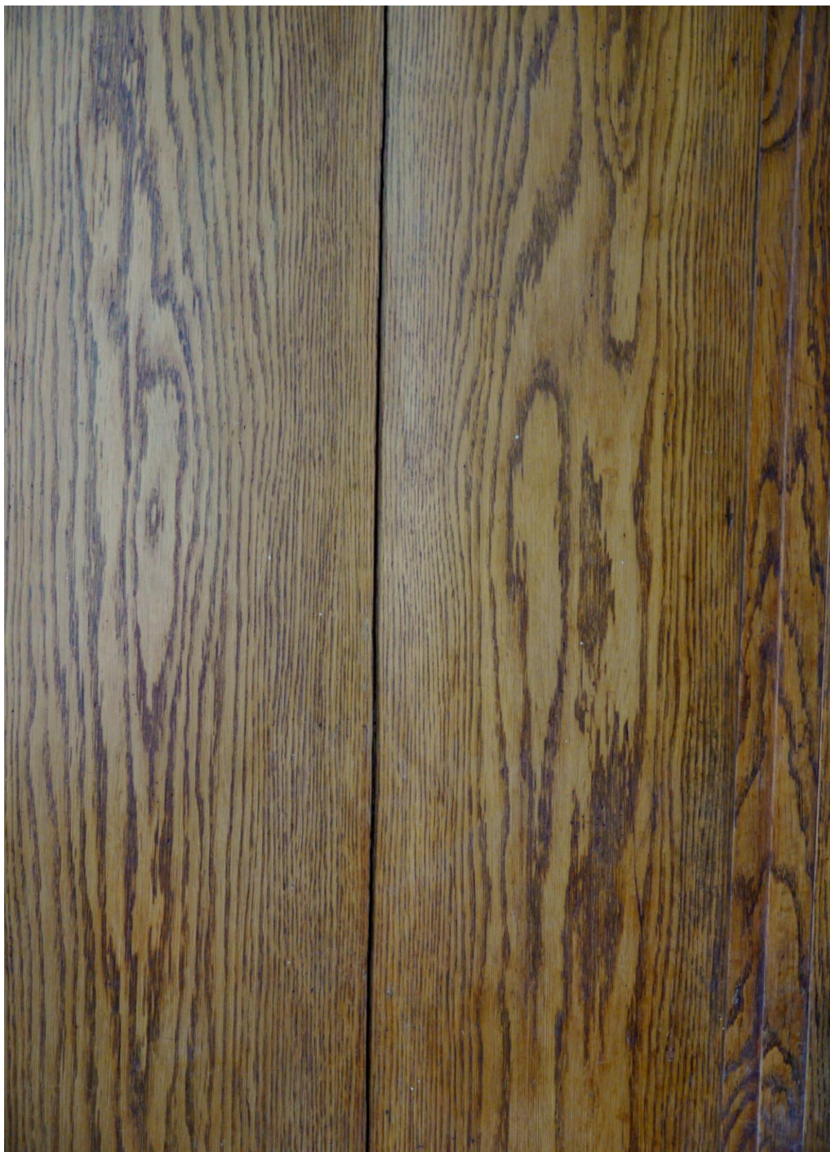
Obr. č. 5. Stav při průzkumu – vestavěná skříň /levá část/ – detail Levá skříň má rozklíženou výplň dveří. Obě poloviny výplně jsou lehce prohnuté.