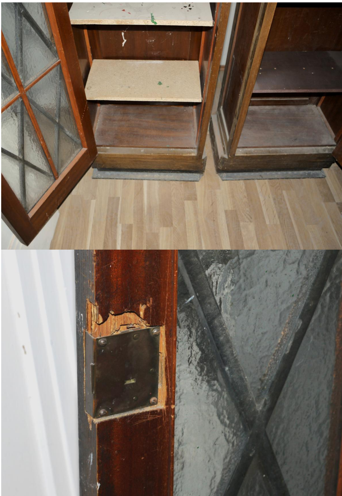
Obr. č. 24+25. Stav při průzkumu - skříň 3dílná – detail Obě prosklené části byly řešené jako policové. Část polic chybí a je nahrazena novými deskami /dřevotříská/. Na levé skříni je osazen zámek na klíč /fab/.