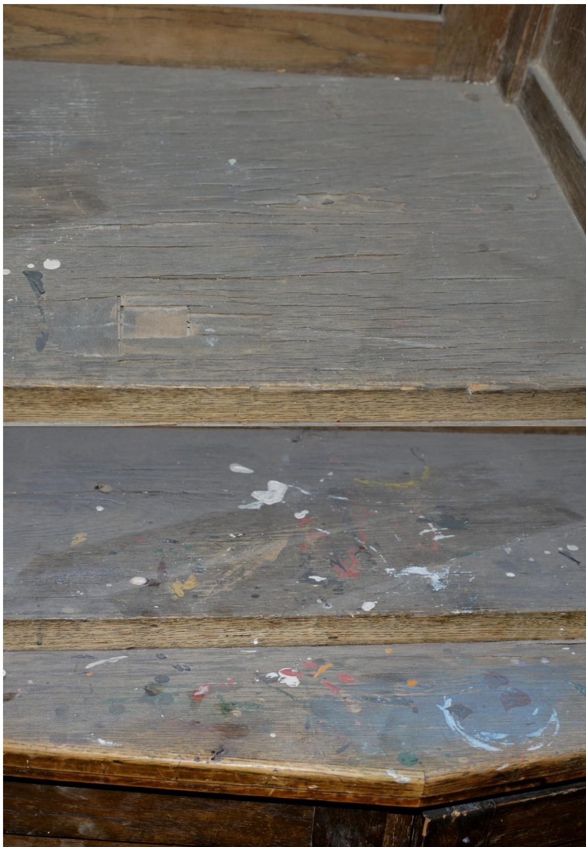
Obr. č. 29+30. Stav při průzkumu - skříň 3dílná – střední část Střední část se dvířky je předsazená před korpus skříně. Vrchní plocha je silně poškozená nevhodným používáním. Dýha je zničená, je popraskaná a stříškovitě se zvedá. Dýhou by bylo vhodné nahradit novým materiálem.