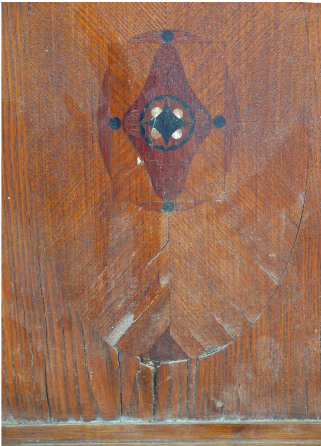
Obr. č. 6. Stav při průzkumu – obklad - detail

Na snímku je ukázka poškození intarzie /poloviční obklad /. Povrchy jsou silně znečištěny, dýha je lokálně odřená, místy se uvolňuje a stříškovitě zvedá. Intarzovaná výzdoba je doplněná perletí. Pod ztmavlým lakem se barevnost použitých dřevin na intarzii ztrácí. Podlepení uvolněné dýhy bez sejmutí obkladu bude problematické.