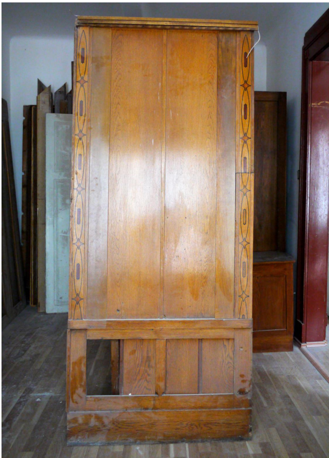
Obr. č. 3. Stav při průzkumu – obklad - celkový pohled

Na snímku je pohledová strana obložení z východní stěny prostoru 507. Obklad je přes celou stěnu a navazuje na skříň na severní straně. Obklad byl při probíhajících pracích snímán. Při snímání došlo k řadě drobných poškození a částečnému narušení konstrukce. Ve spodní části chybí jedna kazeta, spoje jsou uvolněné. Část poškození na ploše byla způsobena již v minulosti při úpravách /pravděpodobně/ el. vedení. S tím souvisí i rozdělení intarzované lišty na pravé straně. Povrch je silně znečištěný, laky jsou ztmavlé. Sokl je u podlahy začernalý a potlučený