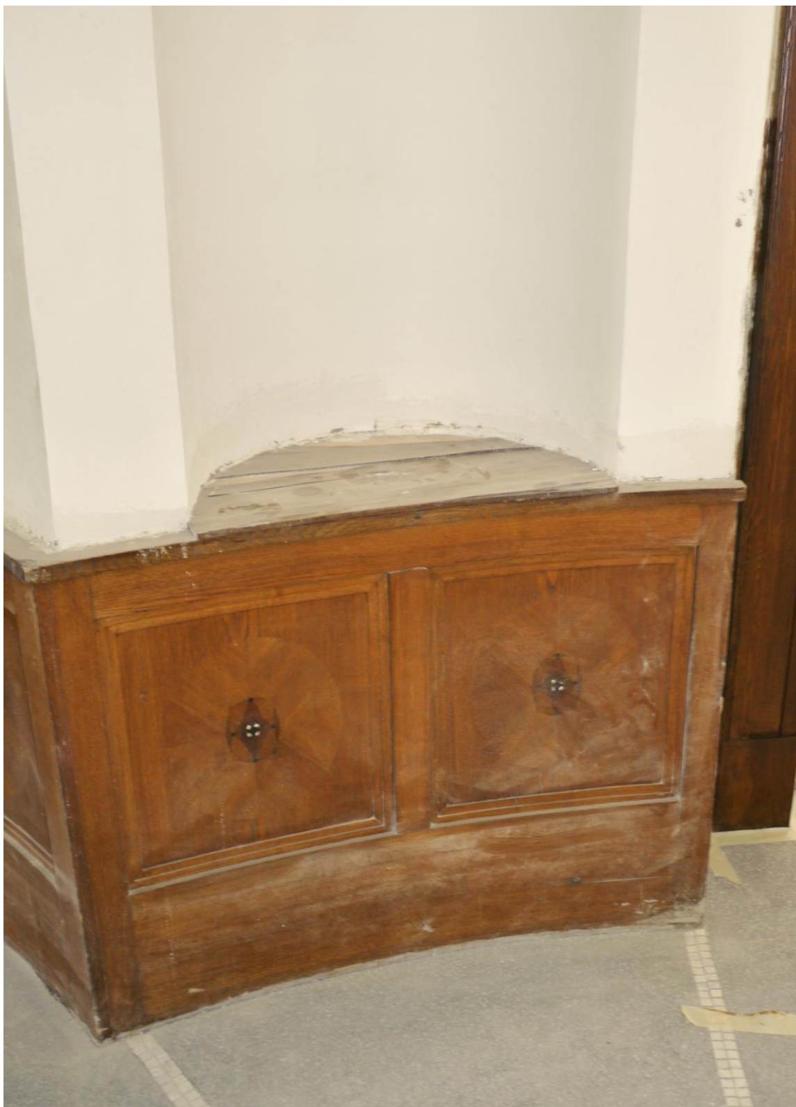
Obr. č. 12. Stav při průzkumu – obklad - detail

Na snímku je vidět vložená překližková deska do dna niky. Stejné řešení je na obou stranách chodby. Borová překližka je dožilá. Pokud bude do niky nutné vložit nový materiál, měl by být dýhovaný dubem, nebo by měl být z dubového masivu.