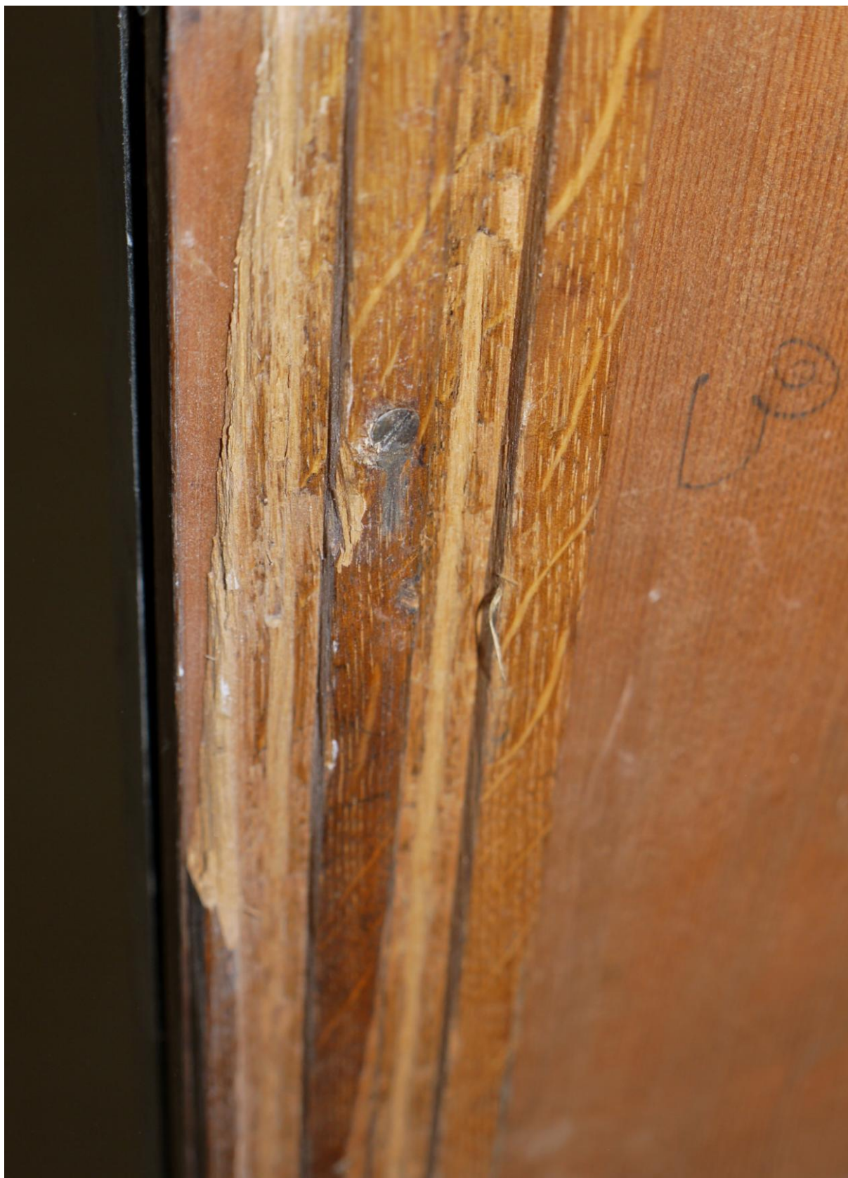
Obr. č. 9. Stav při průzkumu - bankovní přepážka /levá/ - detail Na snímku je vodící lišta se dvěma drážkami na posuvná dvířka /viz foto č. 8. Původní lišty dochované pouze na horní straně jsou ke korpusu uchyceny vruty.