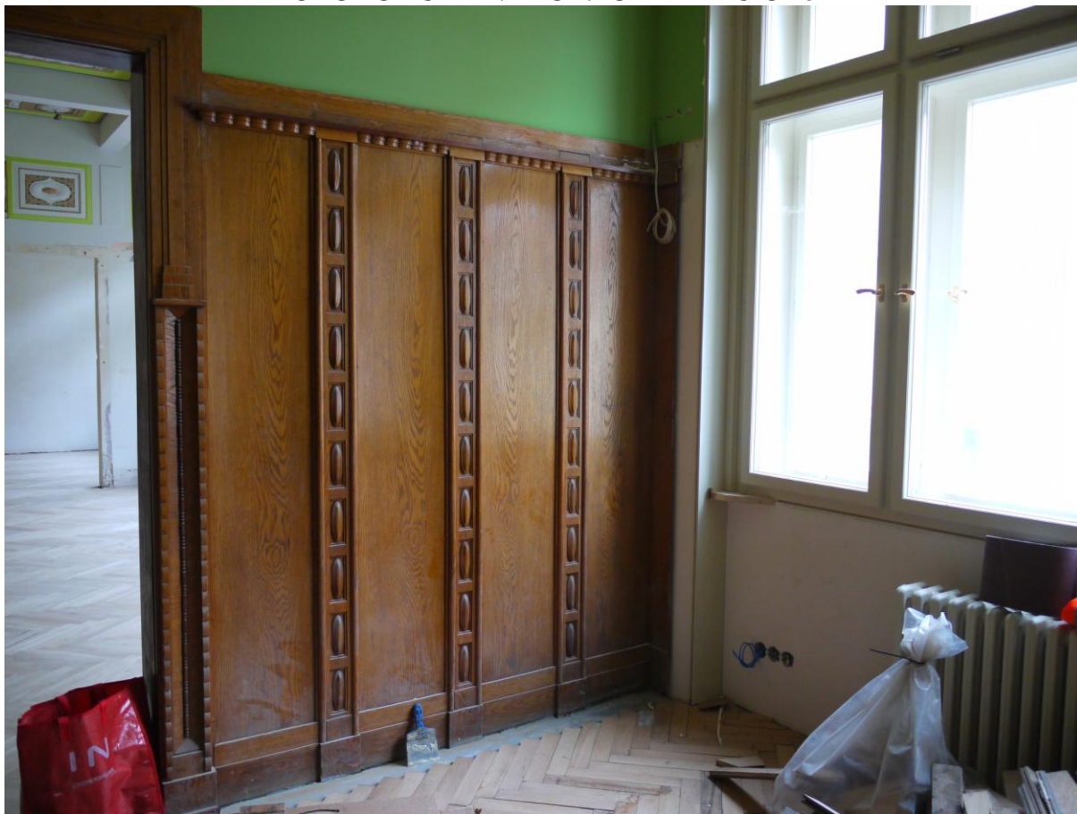
Obr. č. 1. Stav při průzkumu – obklad - celkový pohled

Na snímku je vidět pravá polovina obložení ze severní stěny prostoru 506. Obklad je přes celou stěnu a navazuje na obložku dveří do vedlejšího sálu. Druhý obklad navazuje na obložku dveří na chodbu. Obložení spolu s dalšími prvky /skříň, pohovka atd./ tvoří jeden celek s jednotnou povrchovou úpravou. Oválné aplikace jsou z rozdílné dřeviny /mahagon/. Konstrukčně jsou obklady v pořádku. Obklady nebyly při probíhajících pracích snímány. Povrch je silně znečištěný, laky jsou ztmavlé.