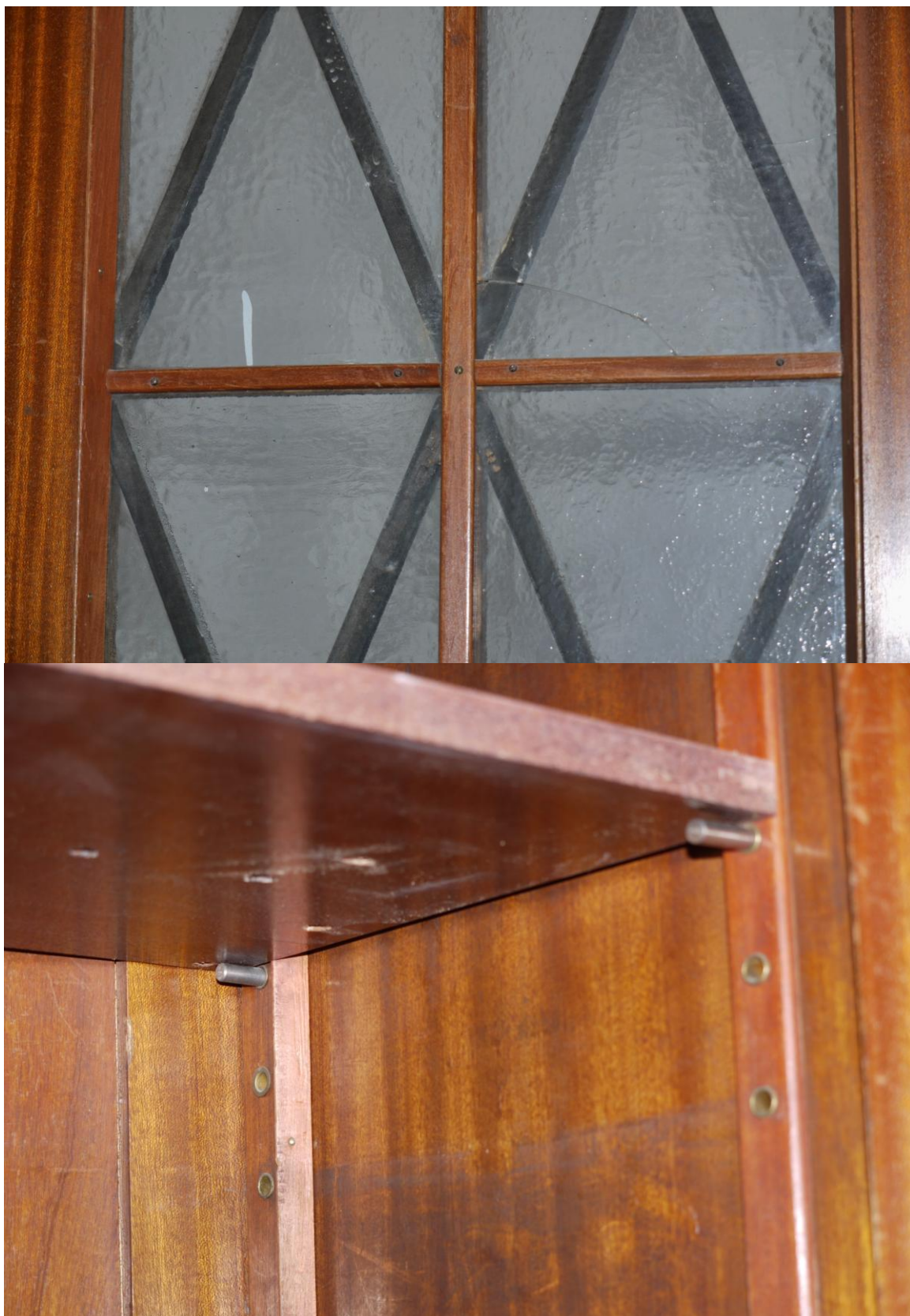
Obr. č. 22+23. Stav při průzkumu - skříň 3dílná – detail Skla na dveřích obou prosklených částí jsou zajištěna přišroubovanými lištami. Obě prosklené části byly řešené jako policové. Jednotlivé police jsou posazeny na kovové kolíčky zasunuté do kovových zdířek. Část polic chybí a je nahrazena novými deskami /dřevotřísky/.