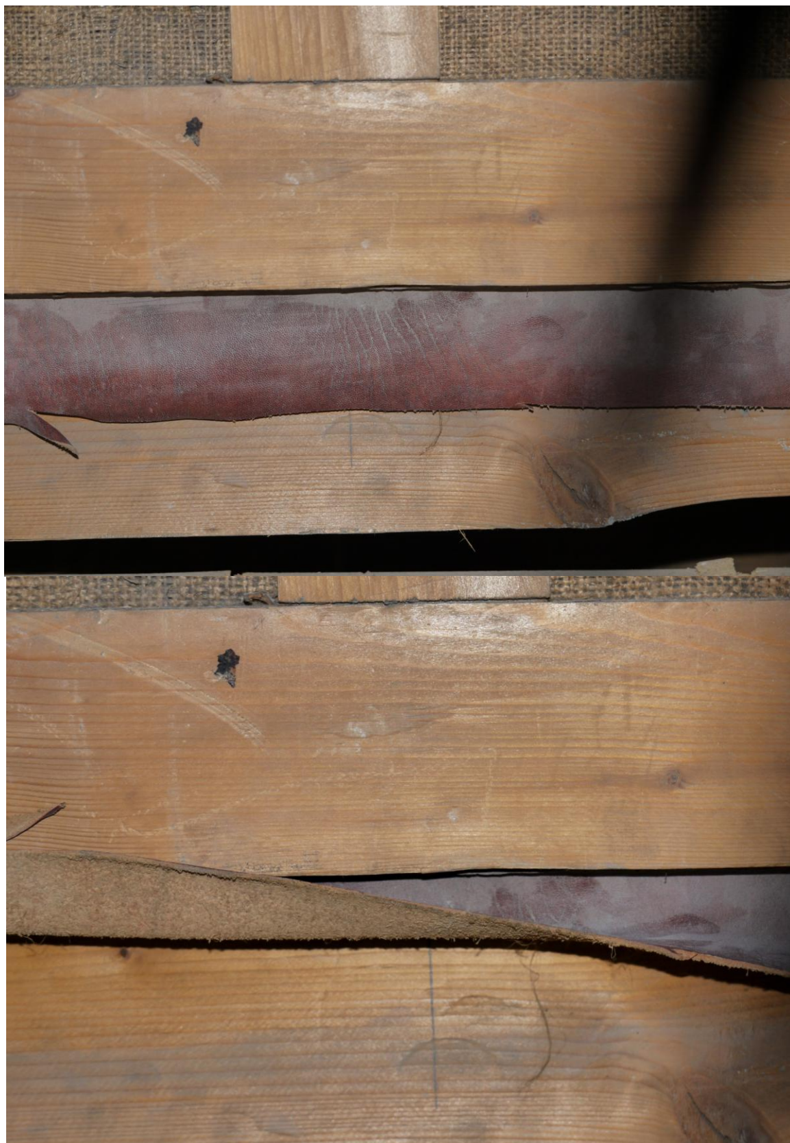
Obr. č. 6+7. Stav při průzkumu - pohovka – detail

Dochovaný původní opěrák je se starším potahem z tmavě červené kůže. Nemusí jít nutně o původní řešení. K upřesnění datace potahu bude nutné rozšířit průzkum o průzkum čalounění.