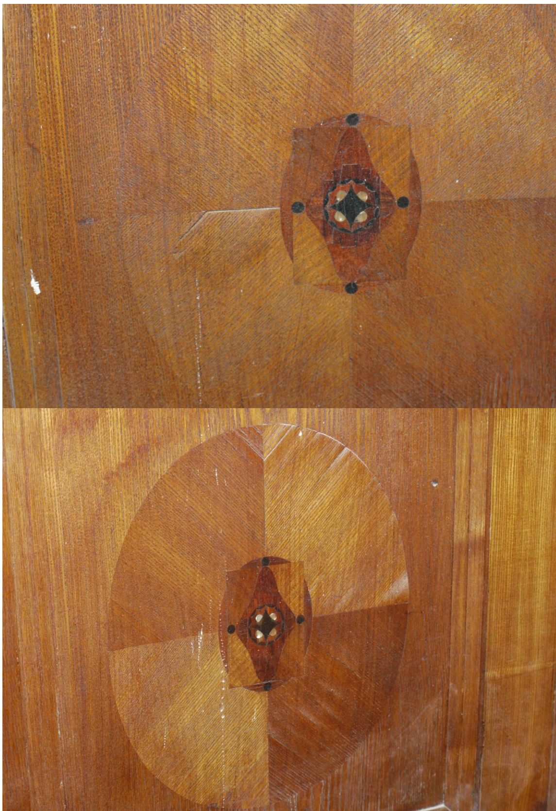
Obr. č. 8+9. Stav při průzkumu – obklad - detail Na snímku je ukázka poškození obkladu. Povrchy jsou silně znečištěny, dýha je lokálně odřená /zejména na hranách. Místy se dýhování uvolňuje a stříškovitě zvedá.