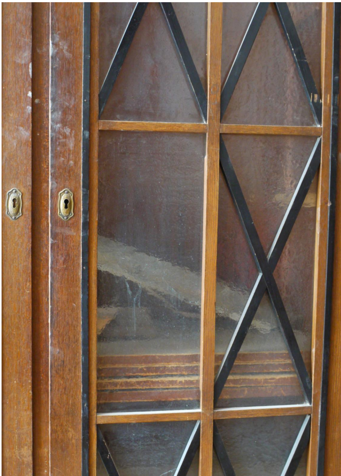
Obr. č. 11. Stav při průzkumu – skříň – detail – čelo skříně Povrch skříně je silně znečištěný s řadou povrchových poškození. Chybí část zdobných černých lišt. Mosazné štítky jsou dochované. Lakování černých prvků je poškozené a bude nutné jej obnovit.