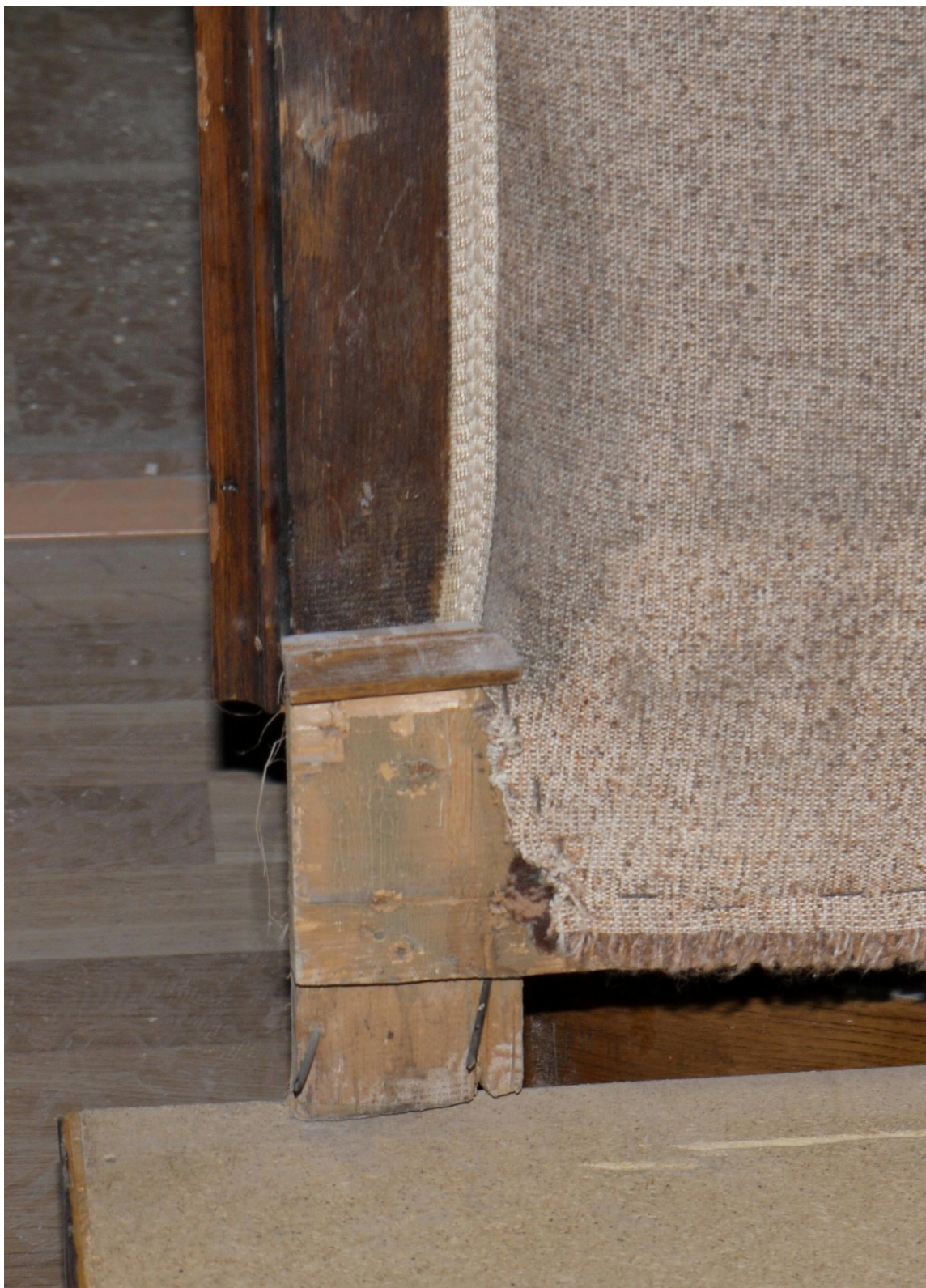
Obr. č. 3. Stav při průzkumu - pohovka - detail Povrch je silně znečištěný a poškrábaný, staré laky jsou ztmavlé. Dochovaný opěrák je původní. K nové soklové části byl uchycen hřebíky.