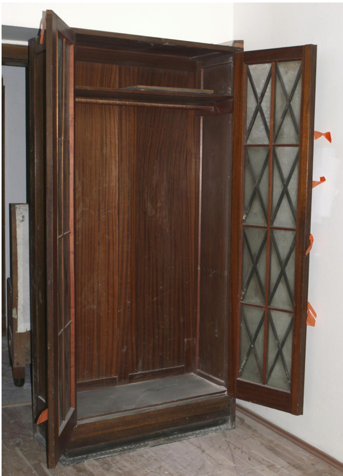
Obr. č. 14. Stav při průzkumu - skříň - celkový pohled Na snímku je levá polovina skříně v otevřeném stavu. Skříň byla původně řešena jako šatní s jednou policí nad nosnou tyčí ramínek. Lišty z vrcholu skříně jsou sejmuté. Stav je shodný s první polovinou skříně.