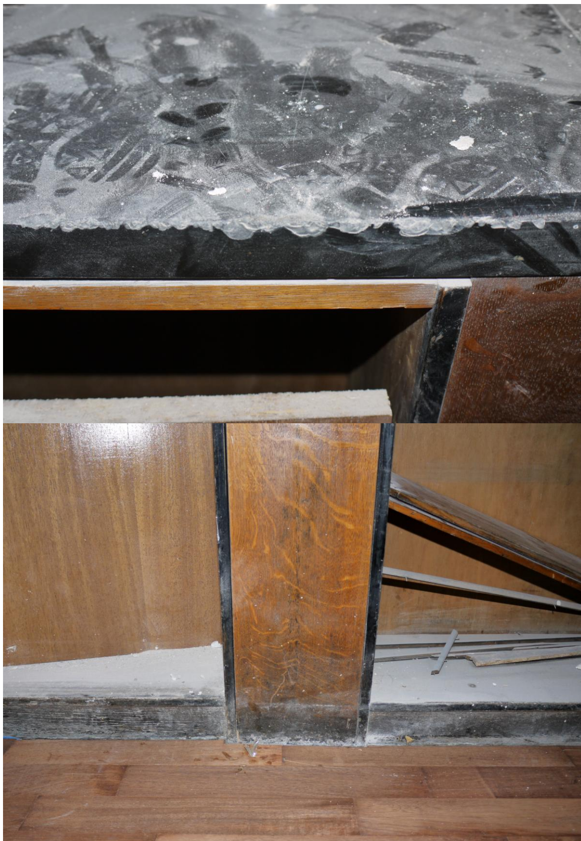
Obr. č. 4+5. Stav při průzkumu - bankovní přepážka /levá/ - detail Na snímku č. 4 je vidět poškození pracovní desky z černého kamene. Spodní část nosné skříňky /zejména sokl/ je silně znečištěná a zčernalá. Do jaké míry půjde sokl zbavit začernání, se ukáže až při restaurování.