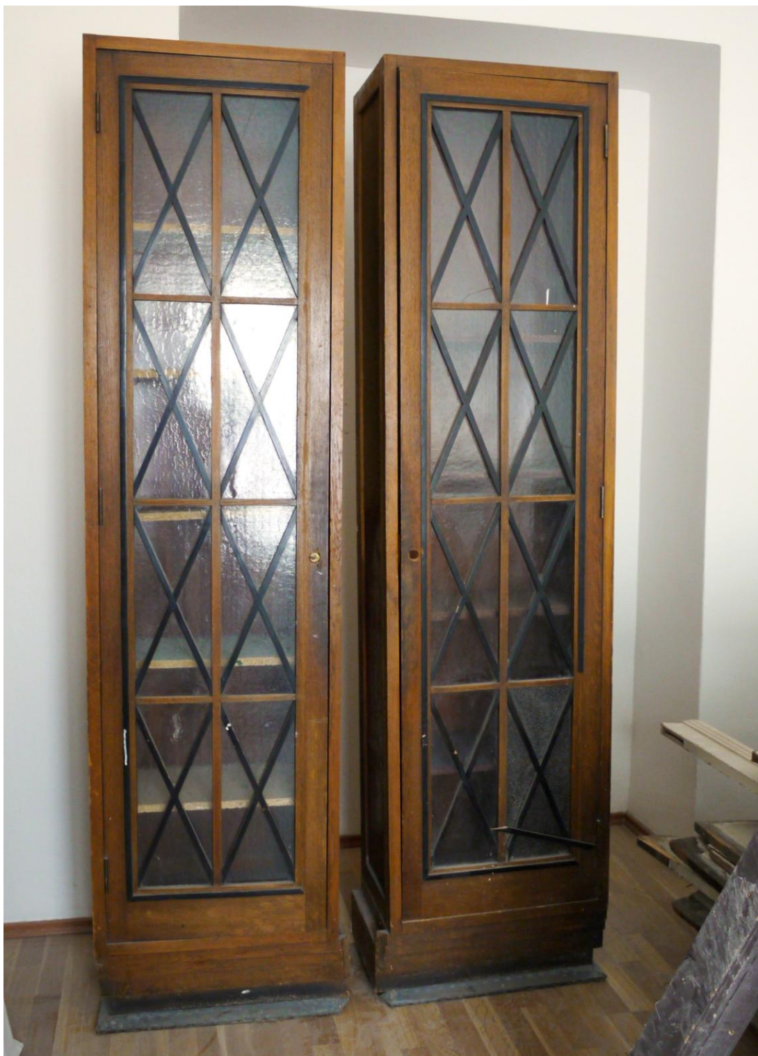
Obr. č. 18. Stav při průzkumu - skříň 3dílná - celkový pohled

Na snímku jsou boční části ze skříně složené ze tří částí. Sokl je v dolní části potažen plechem z barevného kovu. Na skříně je řada povrchových poškození, chybí černé lišty. Povrch skříně je silně znečištěný, laky jsou ztmavlé. Zámky na dveřích chybí. Skla jsou zajištěna z vnitřní strany přišroubovanou lištou. Podrobnosti viz detaily.