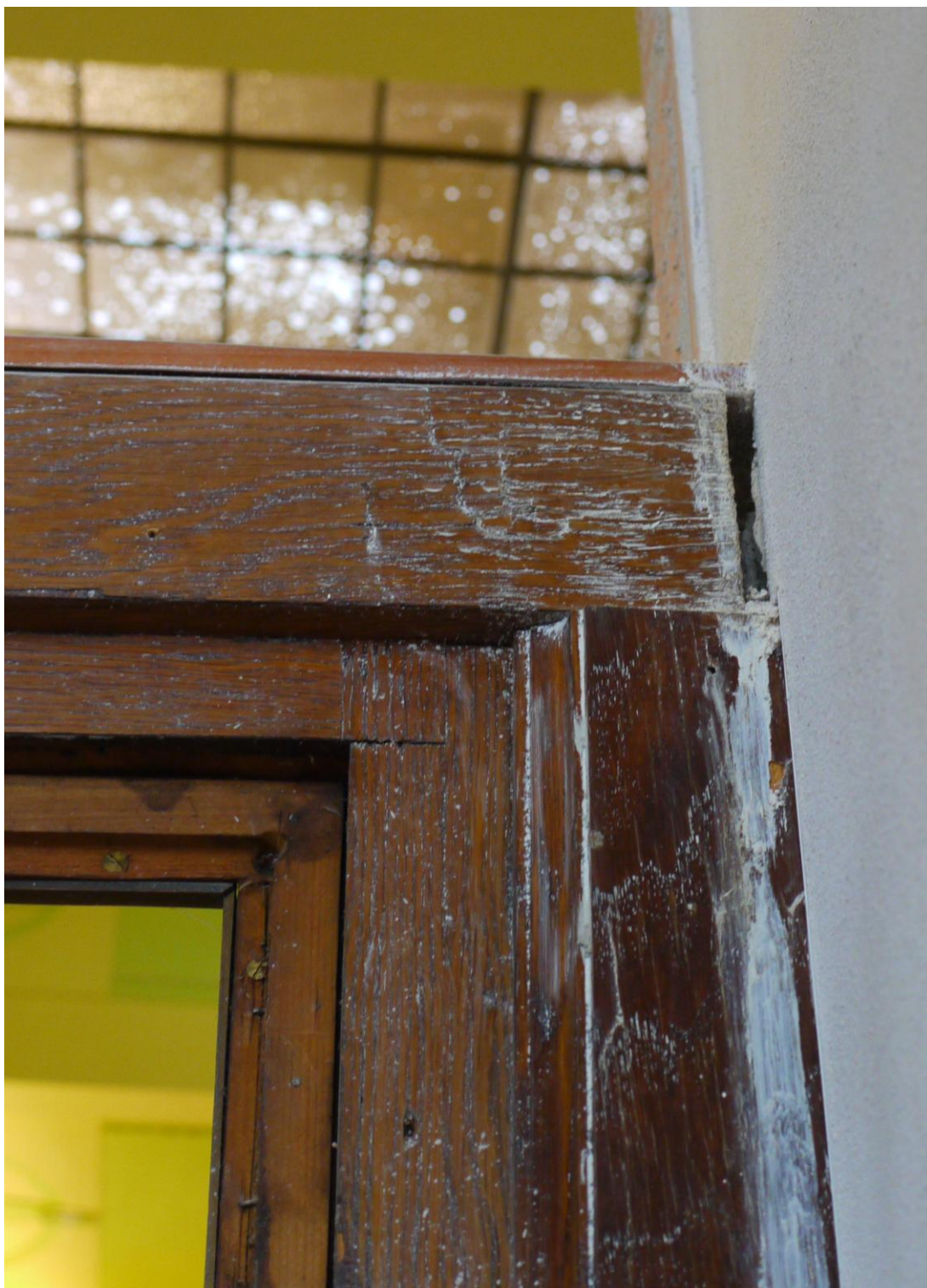
Obr. č. 15. Stav při průzkumu - bankovní přepážka /pravá/ - detail Na snímku je ukázán stav po stavebních pracích. Povrch je znečištěný, bude nutné vyřešit začištění styku mezi přepážkou a stěnou a to na obou dílech přepážky /horní i dolní část/. Také je dobře patrné místo kde chybí černě lakované rámečky z lišt.