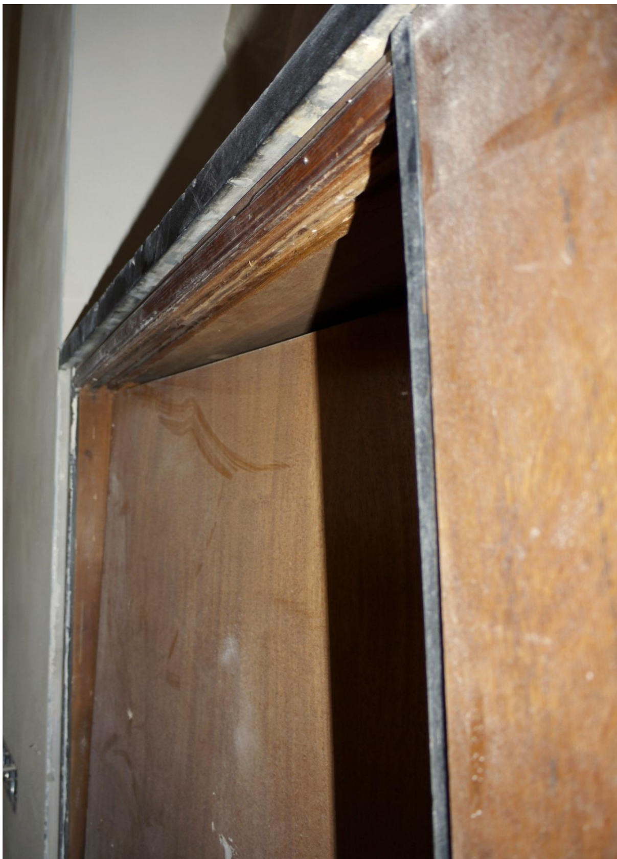
Obr. č. 8. Stav při průzkumu - bankovní přepážka /levá/ - detail Na snímku je vidět vnitřní horní vodící lišta se dvěma drážkami na posuvná dvířka. Původní lišty dochované pouze na horní straně jsou z dubového dřeva a jsou poničené. Pokud se bude původní řešení vracet, bude nutné vodící lišty řešit spolu i s vedením na spodní straně.