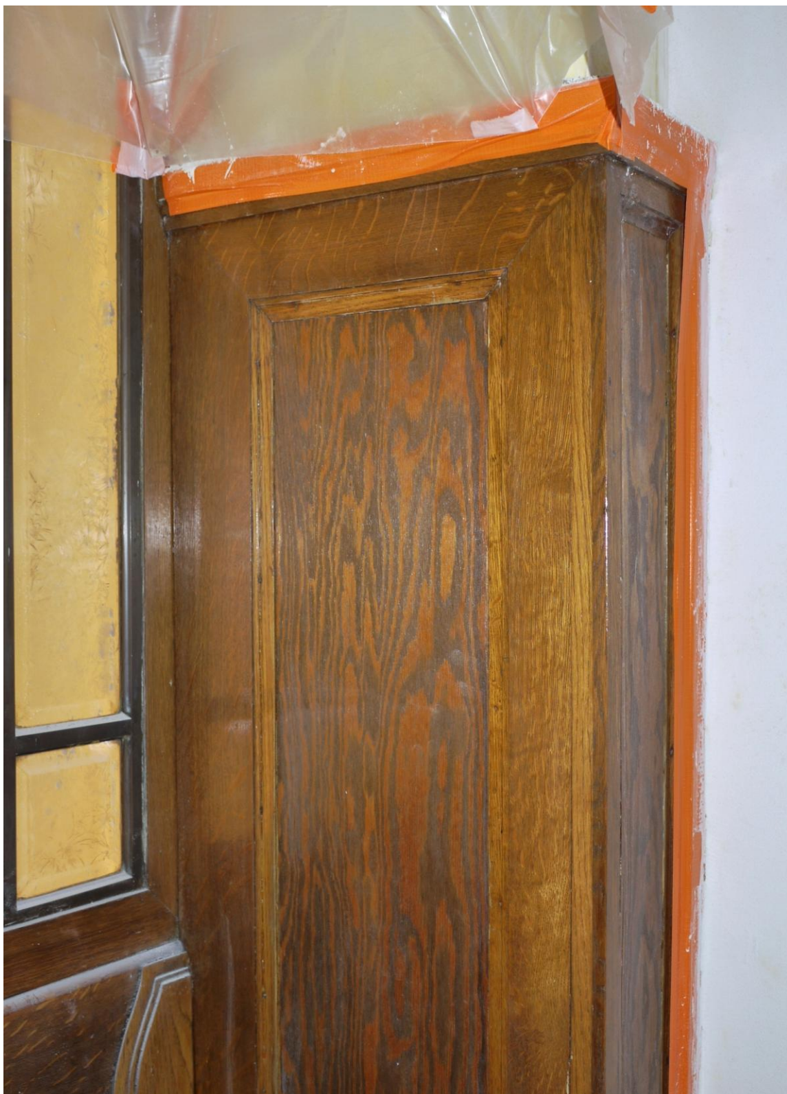
Obr. č. 2. Stav při průzkumu – lavička – detail

Na obou stranách navazujícího obkladu je do výplní vsazena borová překližka. Překližku by bylo vhodné nahradit materiálem s dubovou dýhou.