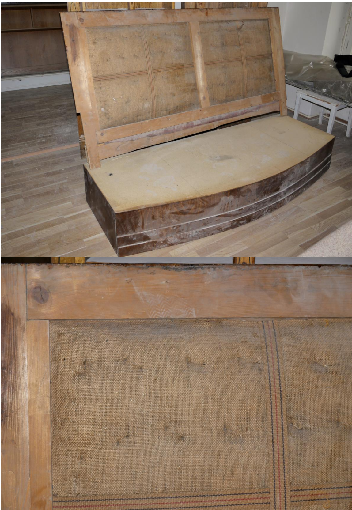
Obr. č. 4+5. Stav při průzkumu - pohovka – celek + detail Dochovaný původní opěrák je rámové konstrukce s dochovaným původním základním nábojem čalounění. Potahová látka nebyla snímána, ale je velmi pravděpodobné, že základní náboj bude možné ponechat bez úprav.