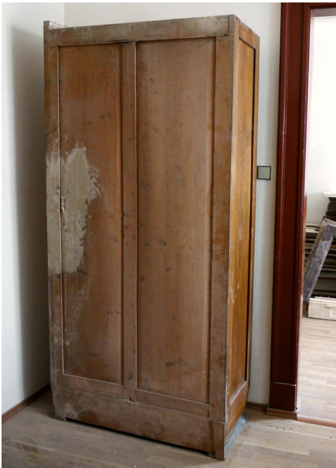
Obr. č. 13. Stav při průzkumu - skříň - celkový pohled Na snímku je vidět konstrukce zad. Konstrukce skříní je rámová. Povrch skříně je silně znečištěný.