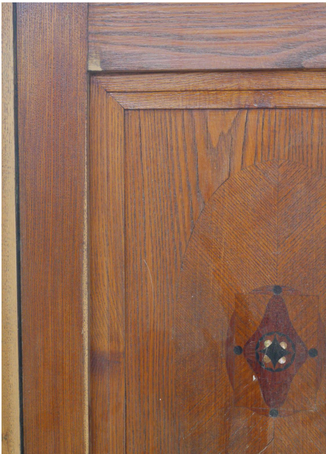
Obr. č. 7. Stav při průzkumu – obklad - detail Na snímku je ukázka poškození obkladu. Povrchy jsou silně znečištěny, dýha je lokálně odřená /zejména na hranách. Místy se dýhování uvolňuje a stříškovitě zvedá.