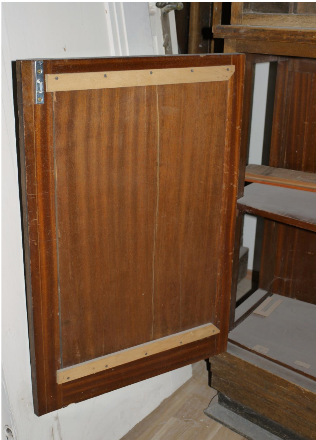
Obr. č. 28. Stav při průzkumu - skříň 3dílná – střední část Vnitřek skříně je dýhovaný mahagonem. Výplně na dvířkách jsou prasklé a kroutí se a jsou dodatečně uchyceny nevhodnými lištami. Novodobá zástrčka na dvířka nepatří.