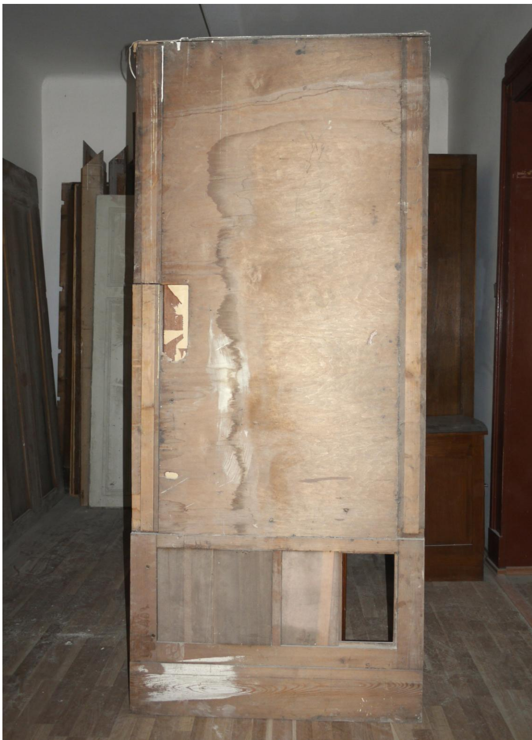
Obr. č. 3. Stav při průzkumu – obklad - celkový pohled

Na snímku je zadní strana obložení z východní stěny prostoru 507. Obklad je přes celou stěnu a navazuje na skříň na severní straně. Ve spodní části chybí jedna kazeta, spoje jsou uvolněné. Část poškození byla způsobena již v minulosti při úpravách /pravděpodobně/ el. vedení. S tím souvisí i rozdělení intarzované lišty na pravé straně. Povrch je silně znečištěný.