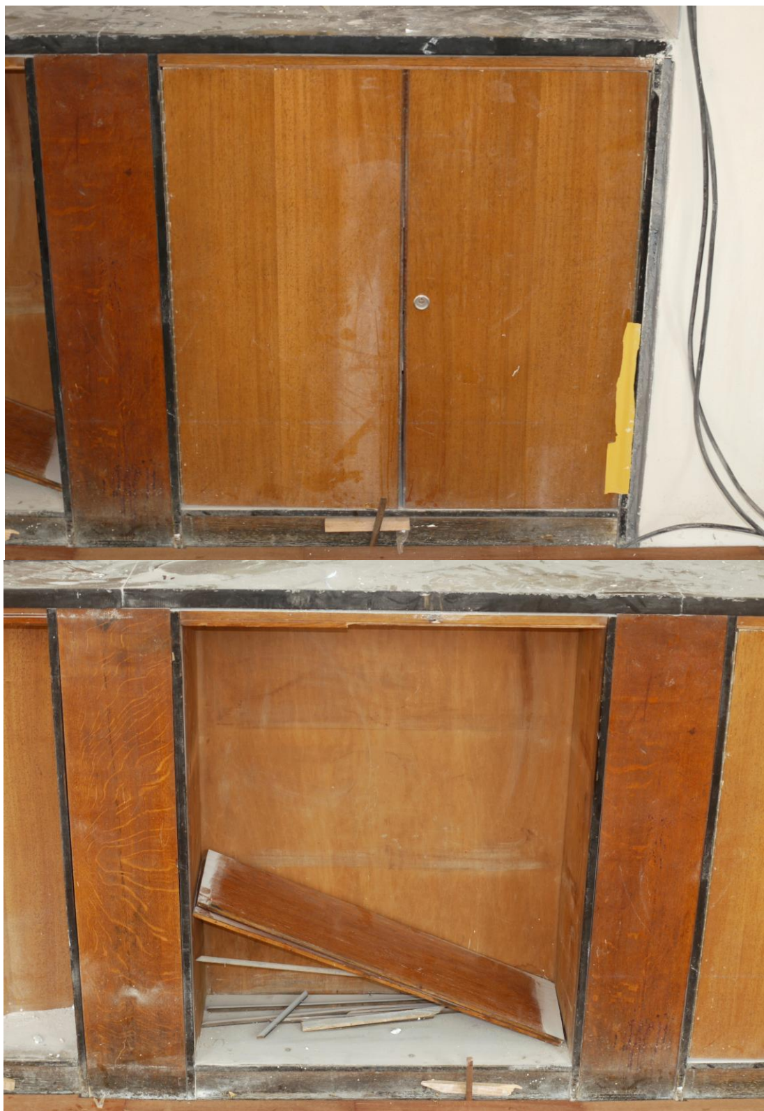
Obr. č. 2+3. Stav při průzkumu - bankovní přepážka /levá/ - detail

Na snímku je levá bankovní přepážka ve vstupní hale /prostor 306/. Spodní část nosné skříňky je silně poškozená, zejména dodatečnými úpravami. Na pravé části jsou jediná dodatečná dvoukřídlá dvířka. Všechny ostatní prostory u obou přepážek byly také dodatečně zaslepené dýhovanou deskou. V otevřeném prostoru byly nalezeny původní police a zbytky lišt.