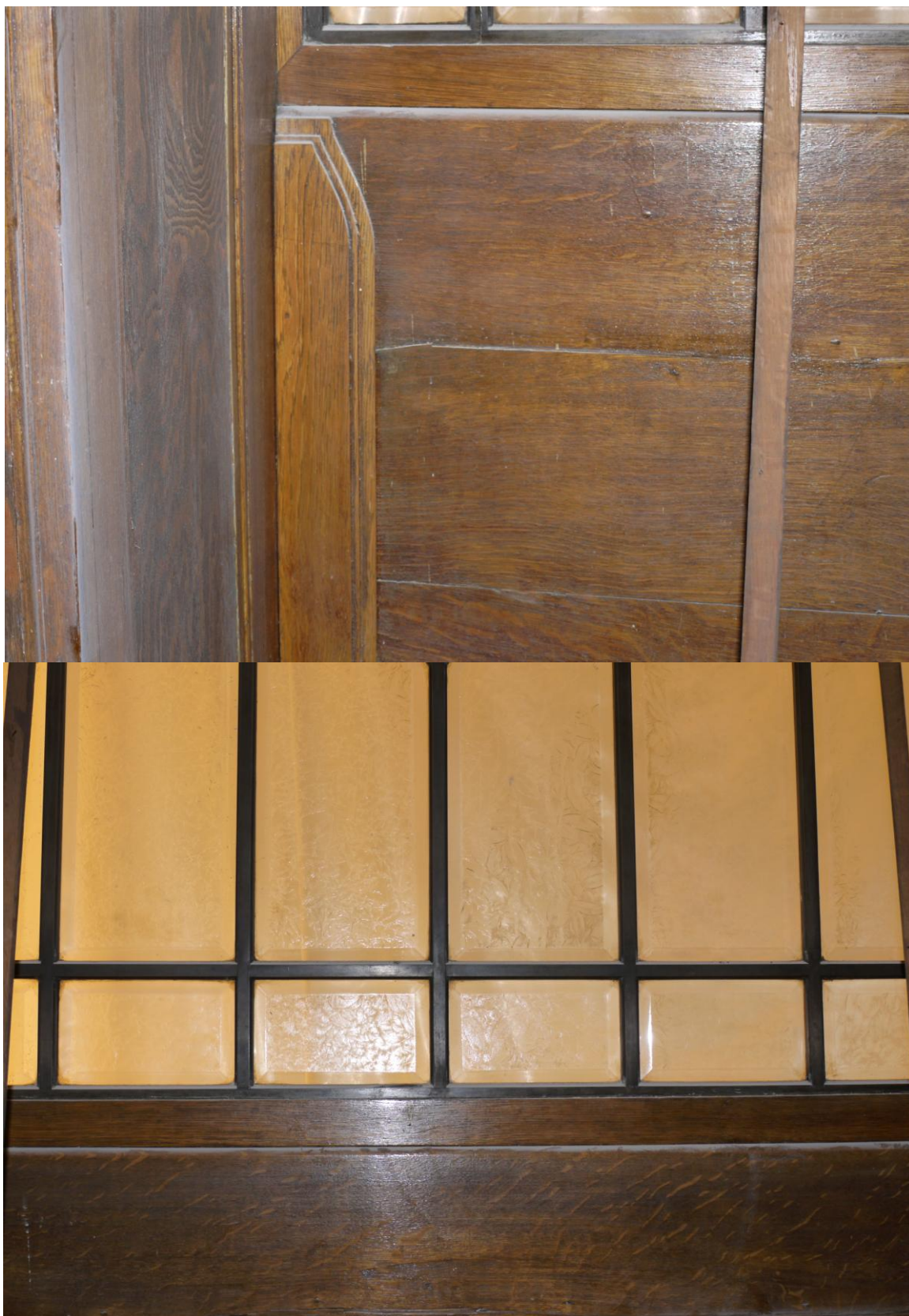
Obr. č. 6+7. Stav při průzkumu – lavička – detail Opěrák sklížený ze tří částí je rozeschlý. Na opěrák navazuje rám s vitráží v kovových rámečcích.