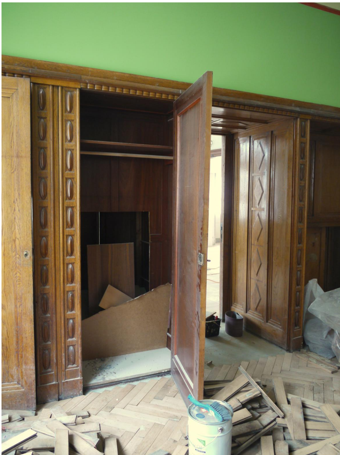
Obr. č. 3. Stav při průzkumu – vestavěná skříň /pravá část/ – celkový pohled Dvě vestavěné skříně mají společnou konstrukci, která je rozdělená příčkami /stěnami/ na více samostatných částí. Části vnitřního členění bylo v souvislosti se stavebními úpravami odstraněno. Není zřejmé, do jakého stavu budou skříně navraceny.