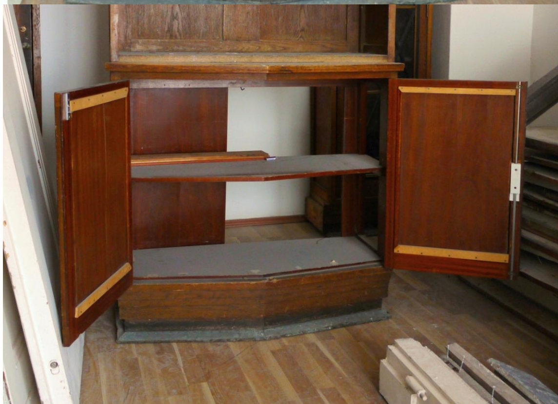
Obr. č. 26+27. Stav při průzkumu - skříň 3dílná – střední část Střední část se dvířky je předsazená před korpus skříně. Zámek není původní., chybí část zad a 1 ks kování z klíčové dírky. Štítek je nahrazen drobnou přítuhou. Celý povrch je silně znečištěný. Vnitřek je dýhovaný mahagonem.