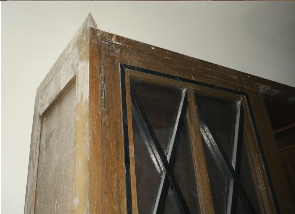
Obr. č. 3+4. Stav při průzkumu – skříň – detail – levá strana Na snímku je levá strana pravé skříně bez povrchové úpravy. Je zřejmé, že se tato strana pohledově neuplatnila a byla zakrytá. Pravděpodobně byla přisazena ke druhé skříni, nebo byla zakrytá navazujícím truhlářským prvkem /stěnou/.