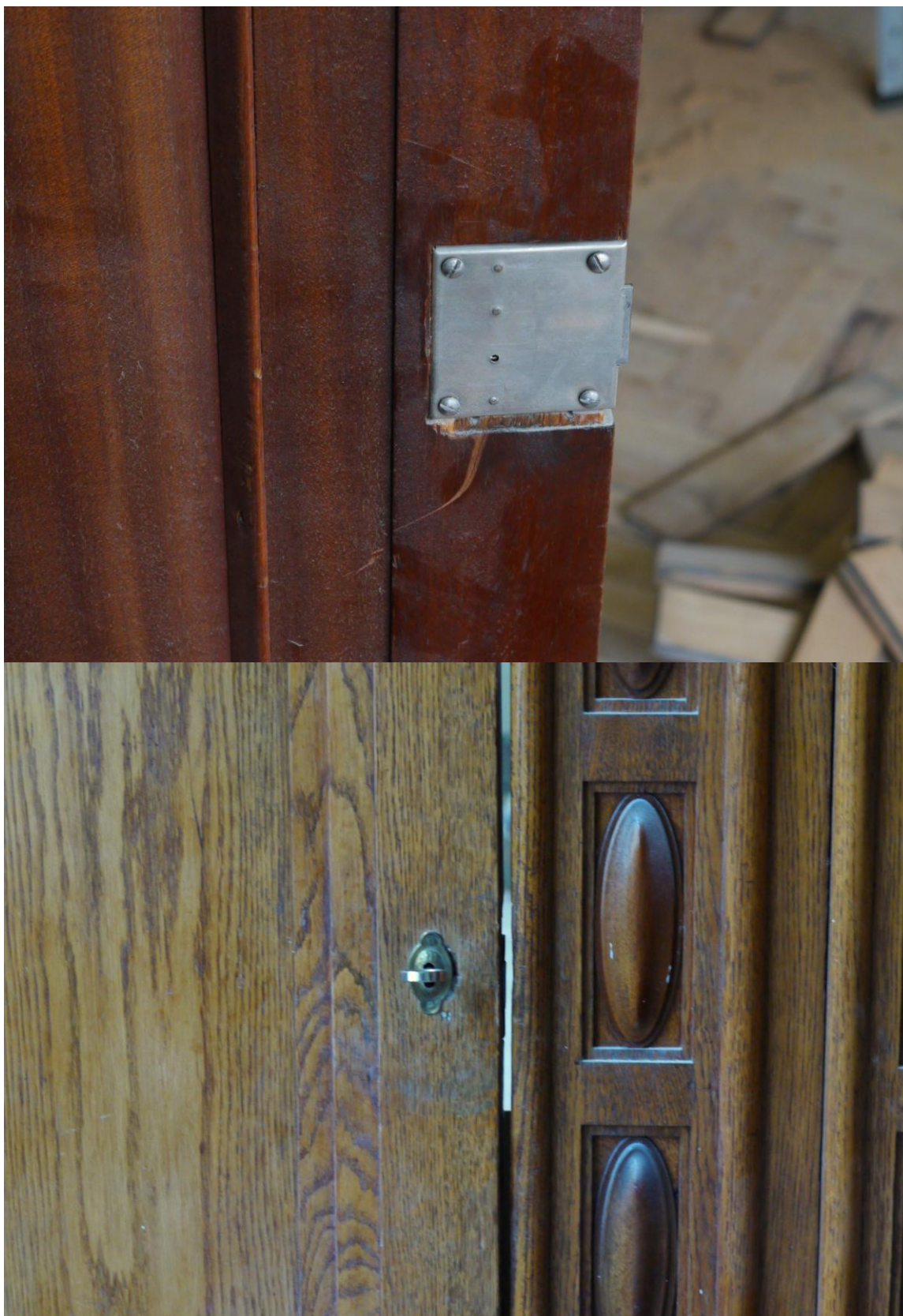
Obr. č. 6+7. Stav při průzkumu – vestavěná skříň /levá část/ – detail Obě skříně mají vyměněné zámky. Na obou dveřích je zachován původní štítek.