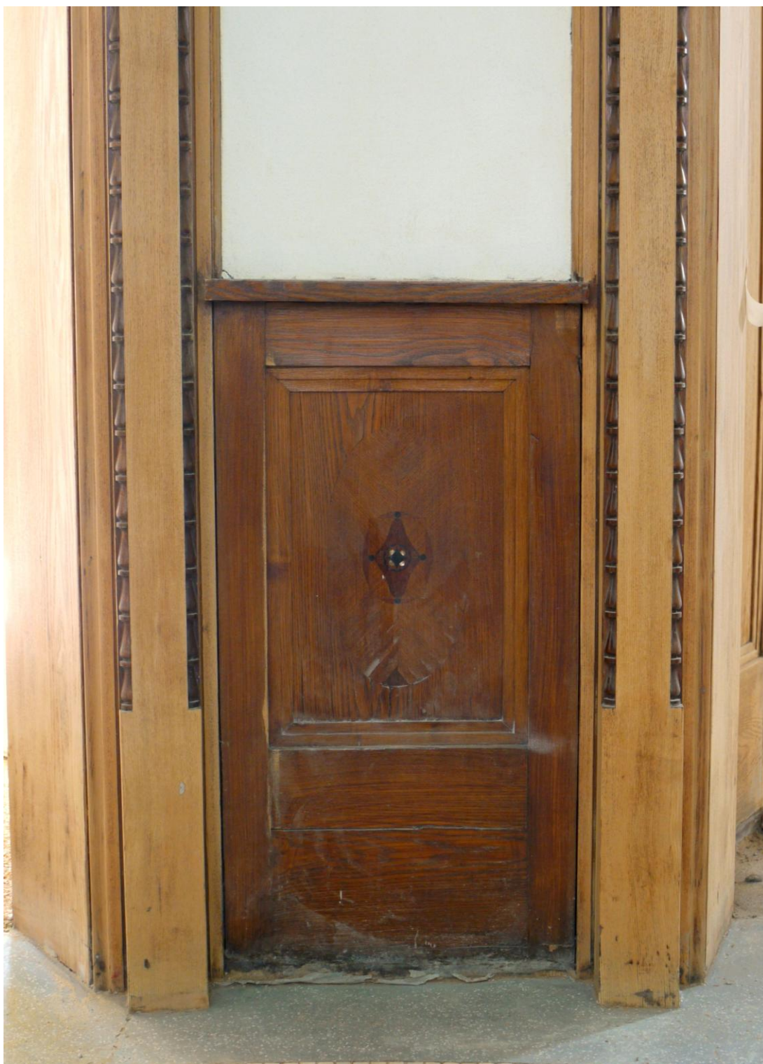
Obr. č. 5. Stav při průzkumu – obklad - celkový pohled

Na snímku je poloviční obklad s jednou kazetou. Obložení spolu s dalšími prvky /zárubně, věšáková stěna/ tvoří jeden celek s jednotnou povrchovou úpravou. Povrchy jsou silně znečištěny, dýha je lokálně odřená, místy se uvolňuje a stříškovitě zvedá. Intarzovaná výzdoba je doplněná perletí.