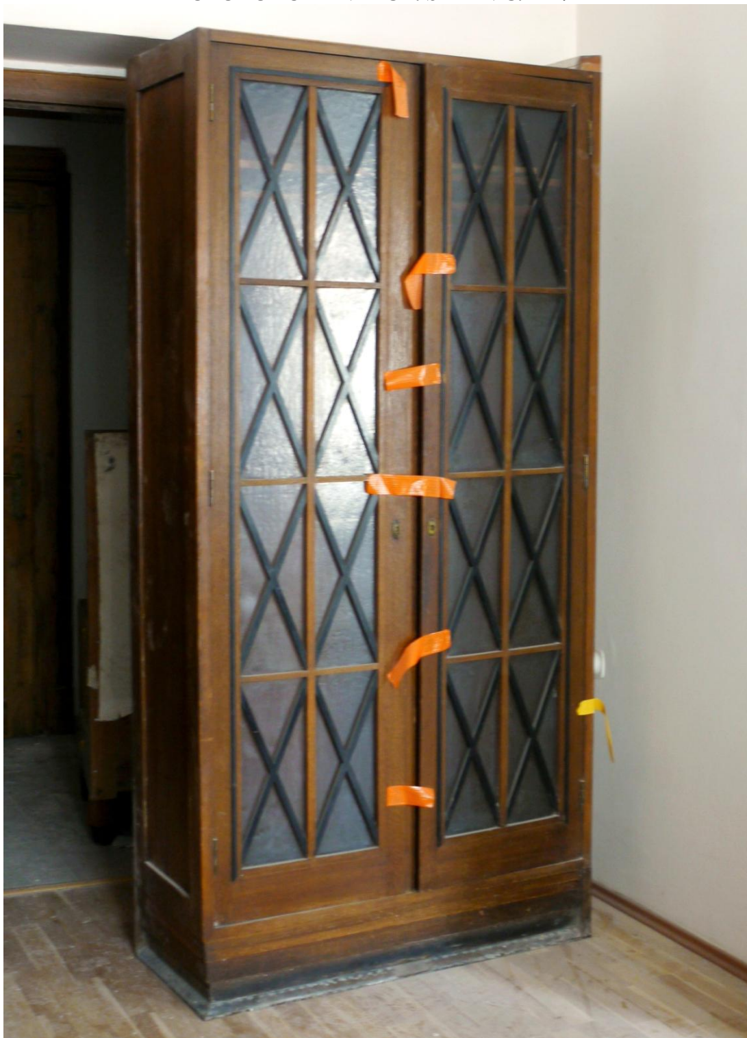
Obr. č. 12. Stav při průzkumu - skříň - celkový pohled

Na snímku je levá polovina ze skříně složené ze dvou částí. Pravý bok je bez povrchové úpravy. Lišty z vrcholu skříně jsou odtržené. Sokl je v dolní části potažen plechem z barevného kovu. Na skříně je řada povrchových poškození, chybí řada černých lišt. Podrobnosti viz detaily. Povrch skříně je silně znečištěný, laky jsou ztmavlé. Některá skla jsou prasklá, jiná vyměněná.