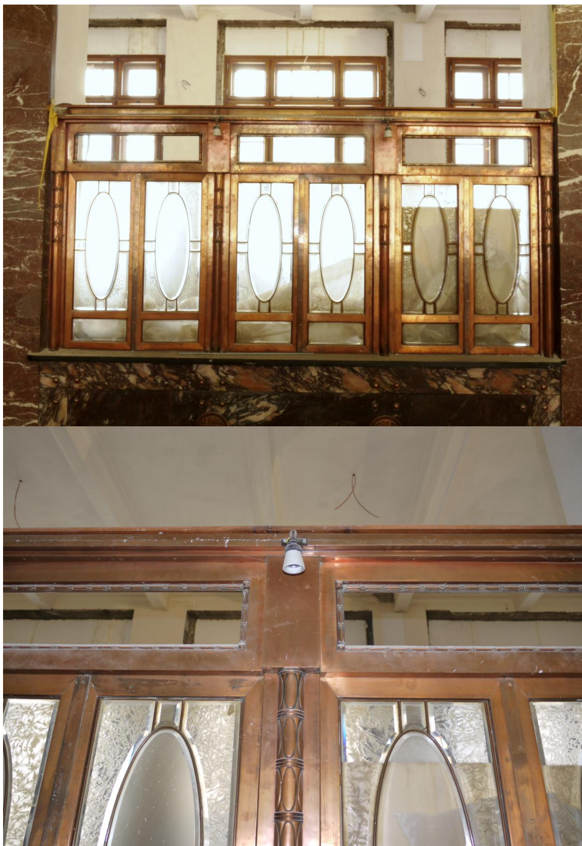
Obr. č. 10+11. Stav při průzkumu - bankovní přepážka /levá/ - detail Na snímcích je vnější strana přepážky potažená v celé ploše měděným plechem. Na horní římse jsou uchyceny lampy. Měděné prvky musí restaurovat odborník s patřičnou licenci MK ČR.