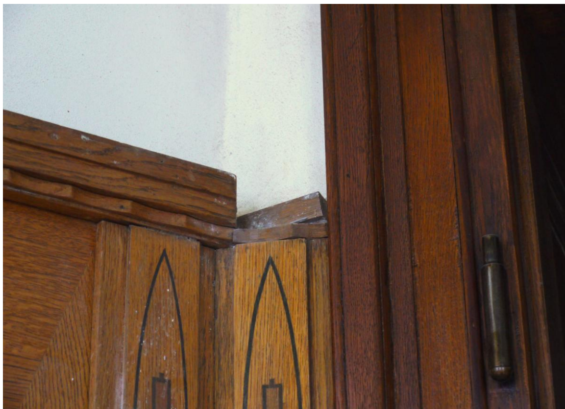
Obr. č. 2. Stav při průzkumu – obklad /západ/ - detail V horní části obkladu chybí drobná část ukončovací zdobné lišty.