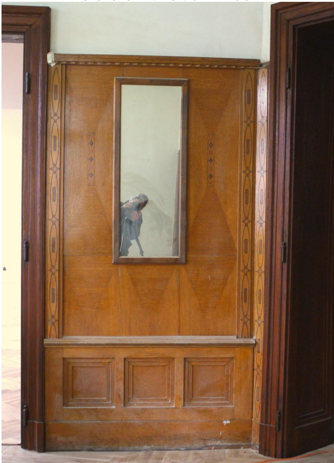
Obr. č. 1. Stav při průzkumu – obklad - celkový pohled

Na snímku je část obložení ze západní stěny prostoru 507. Obklad je přes celou stěnu a navazuje na obložku dveří do vedlejšího sálu a na chodbu. Obložení spolu s dalšími prvky /skříně, kryty radiátorů, obložky dveřních prostupů atd./ tvoří jeden celek s jednotnou povrchovou úpravou. Oválné intarzie z barevných dřevin jsou typické vždy pro jeden prostor. Konstrukčně je obklad v pořádku. Obklad nebyl při probíhajících pracích snímán. Povrch je silně znečištěný, laky jsou ztmavlé. V horní části chybí lišta, sokl je u podlahy začernalý a potlučený.