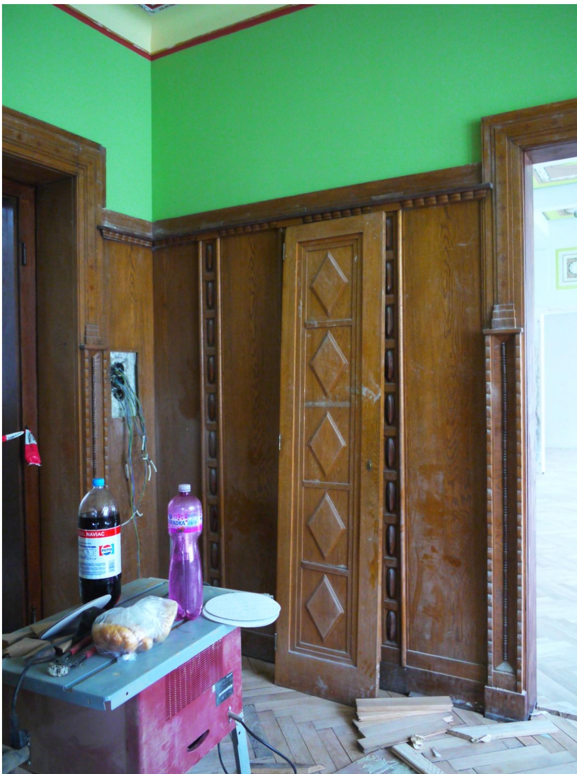
Obr. č. 2. Stav při průzkumu – obklad - celkový pohled

Na snímku je vidět levá polovina obložení ze severní stěny prostoru 506. Obklad je přes celou stěnu a navazuje na obložku dveří do vedlejšího sálu. Druhý obklad navazuje na obložku dveří na chodbu. Obložení je u dveří na chodbu upravováno v souvislosti s novou kabeláží. Obklady nebyly při probíhajících pracích snímány. Povrch je silně znečištěný, laky jsou ztmavlé. Není jasné řešení začistění nové parketové podlahy a soklu obkladu.