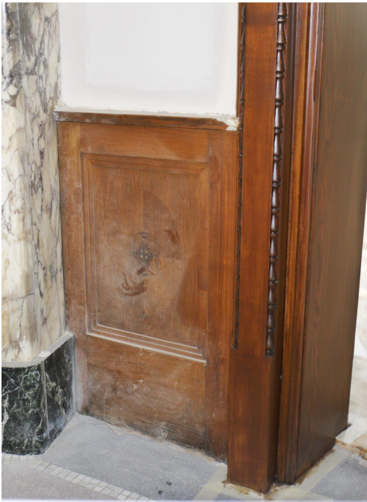
Obr. č. 4. Stav při průzkumu – obklad - celkový pohled Na snímku je obklad vedle krbu. Celkem jsou 3 kusy s jednou kazetou. Dva jsou u krbu a jeden mezi dveřmi.