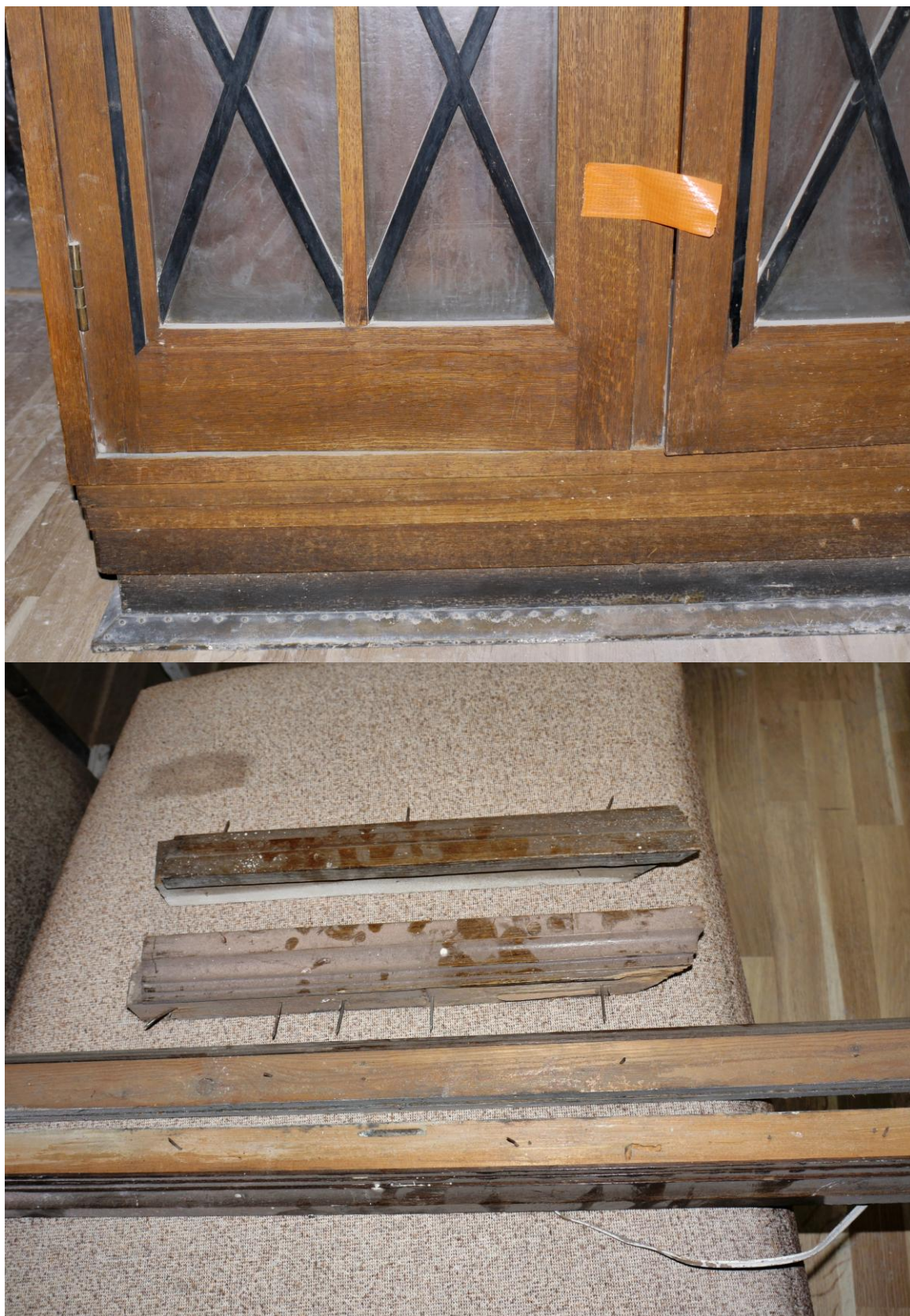
Obr. č. 15+16. Stav při průzkumu - skříň - celkový pohled Na snímku č. 15 je ukázka znečištění na spodní soklové části. Lišty z vrcholu skříně /obr. č. 16/ jsou sejmuté, ale jsou dochované.