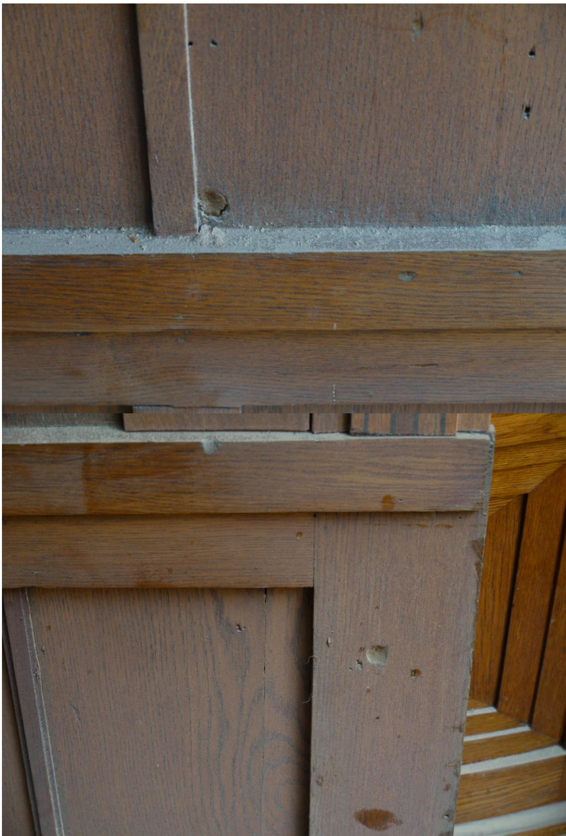
Obr. č. 9. Stav při průzkumu – obklad - detail Na snímku je obložení z východní stěny prostoru 507. Na ploše obkladu je řada drobných poškození.