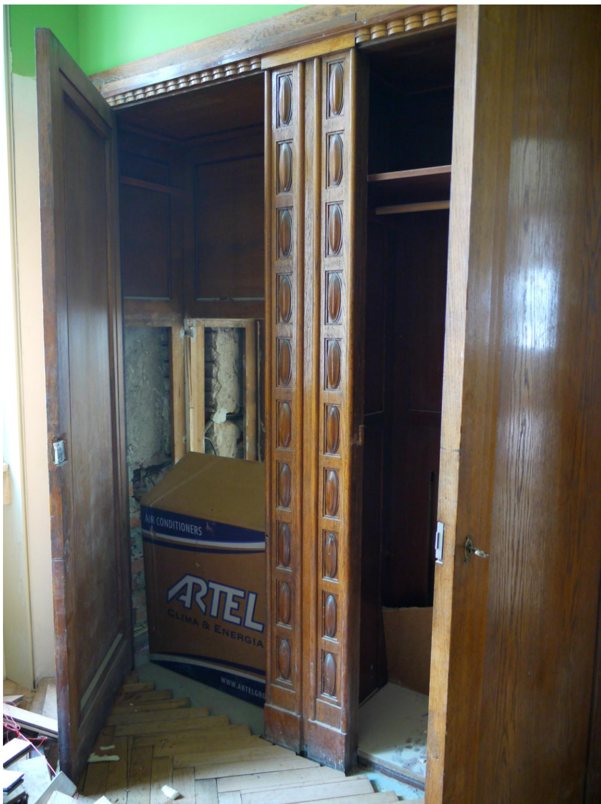
Obr. č. 2. Stav při průzkumu – vestavěná skříň /levá část/ – celkový pohled Dvě vestavěné skříně mají společnou konstrukci, která je rozdělená příčkami /stěnami/ na více samostatných částí. Části vnitřního členění byly v souvislosti se stavebními úpravami odstraněny. Není zřejmé, do jakého stavu budou skříně navraceny.