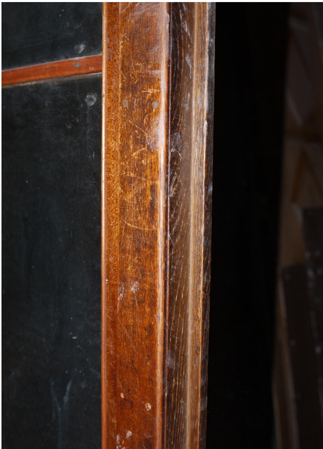
Obr. č. 7. Stav při průzkumu – skříň – detail – dveře skříně Skříň se zamyká rozvorovým polozapuštěným zámkem krytým lištou. Lišta je po celé délce křídla a zakrývá i rozvory ve vodící drážce. Skla jsou uchycena pomocí přišroubovaných lišt. Vnitřní prostor je rovněž silně znečištěný s řadou povrchových poškození.