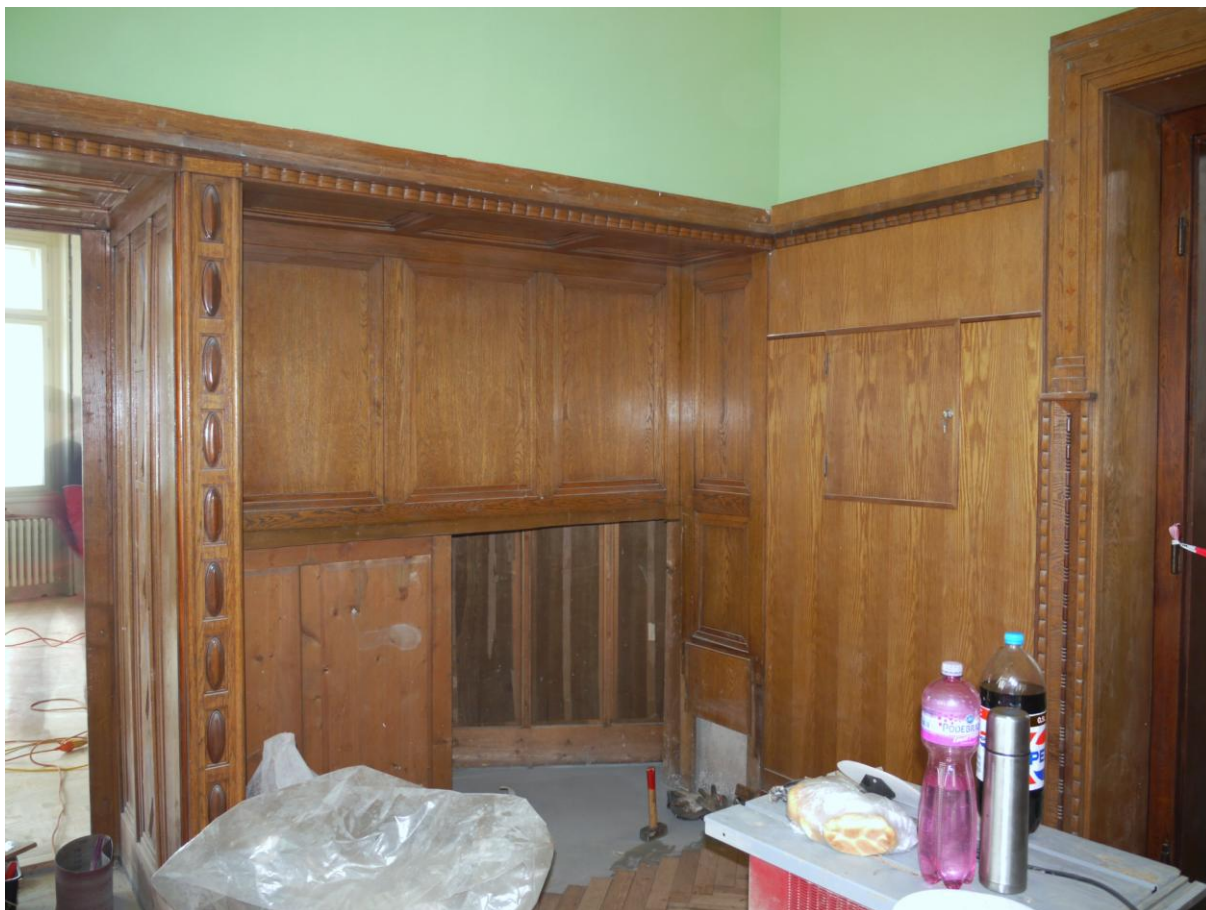
Obr. č. 8. Stav při průzkumu - pohovka – detail Na snímku je místo kam je vsazena pohovka.