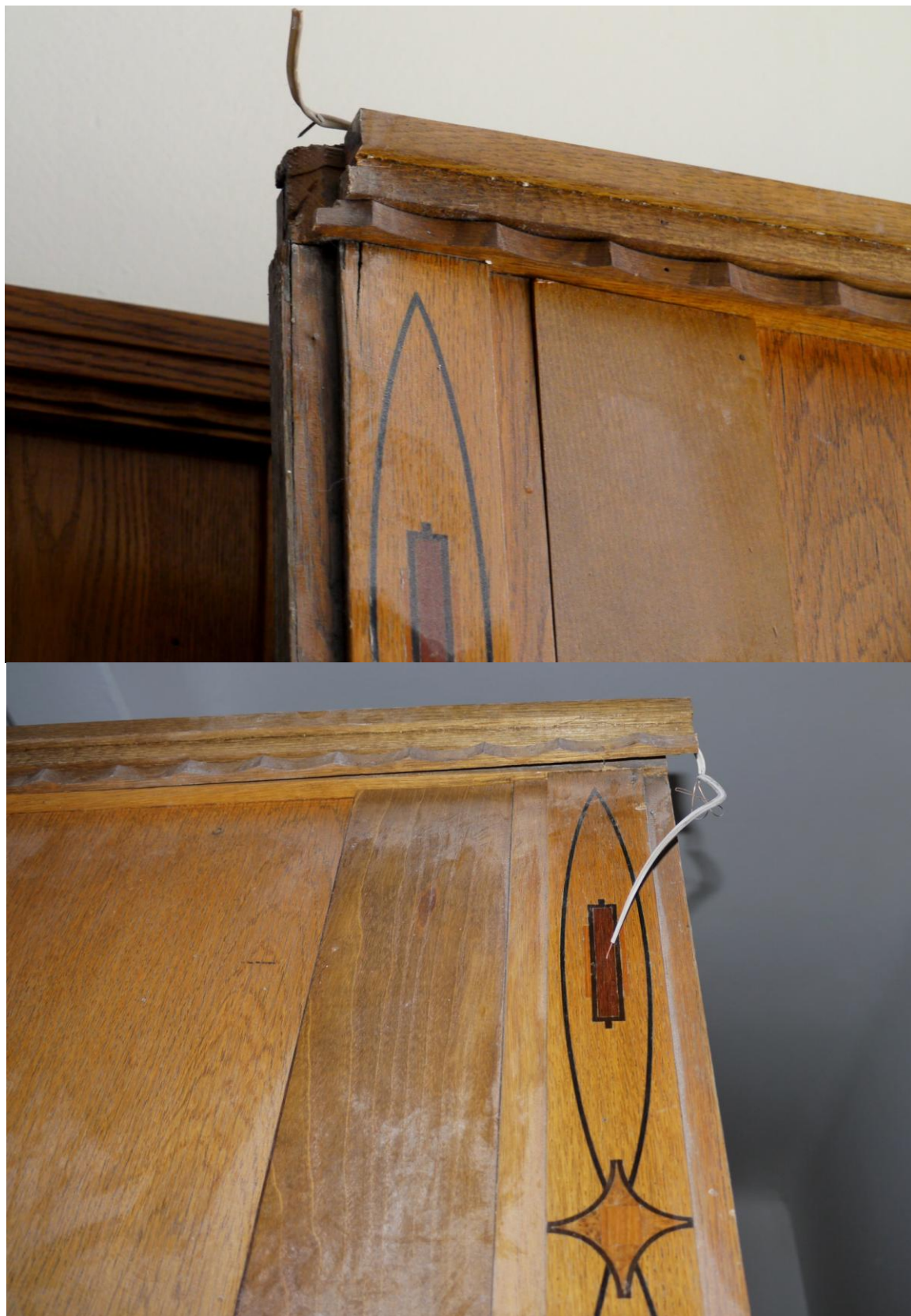
Obr. č. 7+8. Stav při průzkumu – obklad - detail Na snímku je horní část obložení z východní stěny prostoru 507. Část poškození byla způsobena při demontáži, část již v minulosti. Lišty jsou uvolněné, hrany jsou popraskané. Na obložení jsou zbytky elektrického vedení.