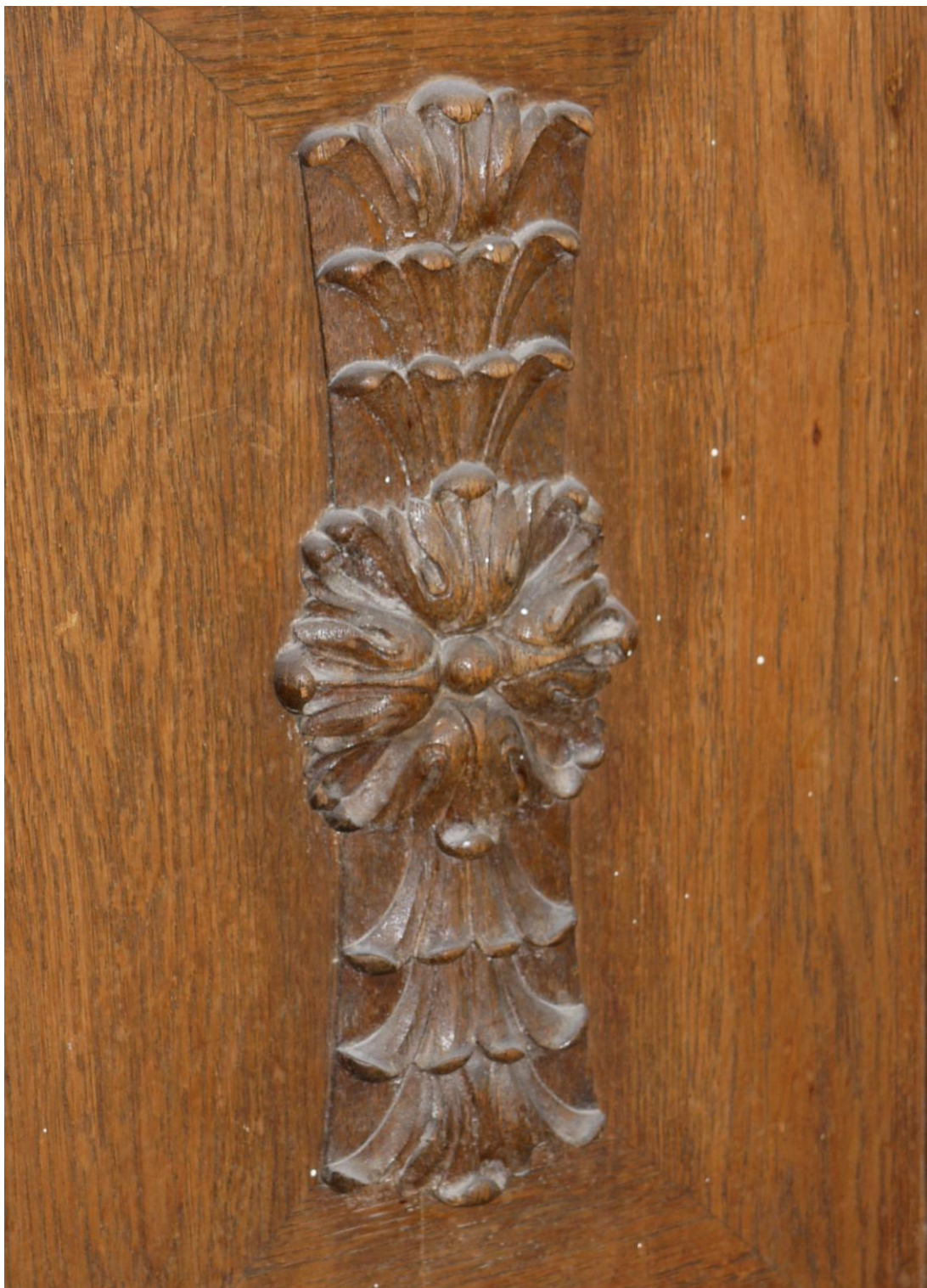
Obr. č. 31. Stav při průzkumu - skříň 3dílná – střední část Na snímku je detail řezby ze dveří. Řezby nejsou poškozené pouze silně špinavé.