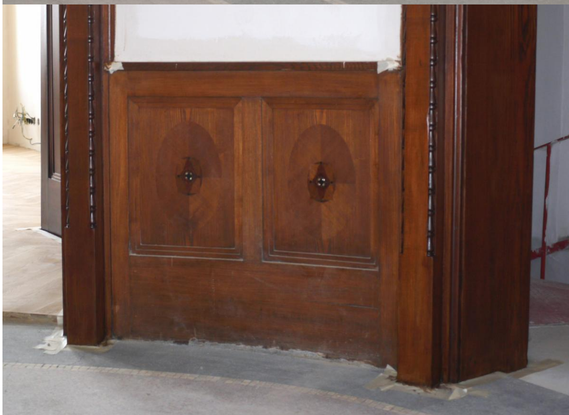
Obr. č. 2+3. Stav při průzkumu – obklad - celkový pohled Na snímku jsou obklady na stěnách. Celkem je 6 obkladů z toho jsou 2 kusy se 4 kazetami, 1 kus se dvěma kazetami a 3 kusy s jednou kazetou.