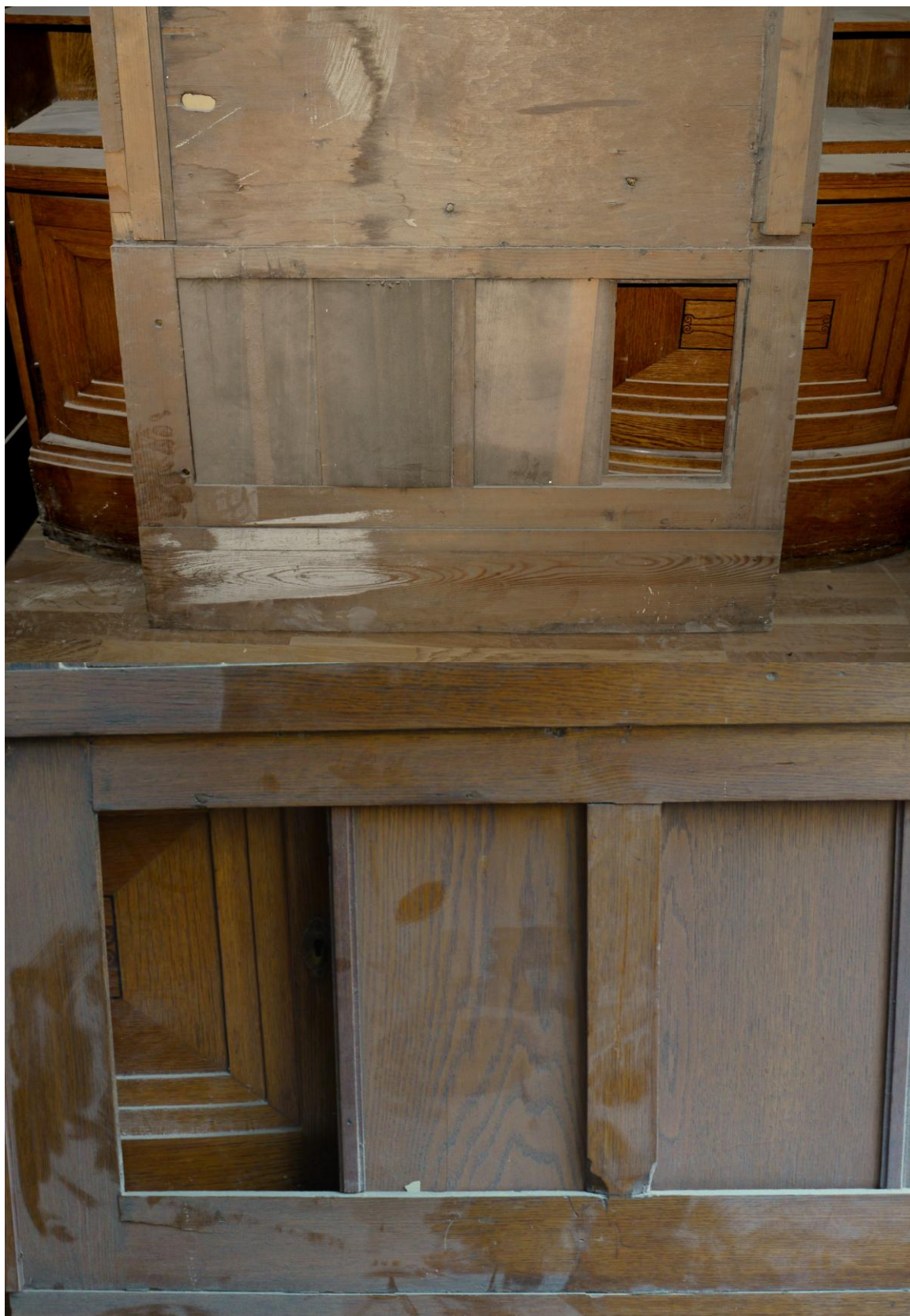
Obr. č. 5+6. Stav při průzkumu – obklad - detail Na snímku je spodní část obložení z východní stěny prostoru 507. Část poškození byla způsobena při demontáži, část již v minulosti. Chybějící kazeta nebyla při průzkumu nalezena.