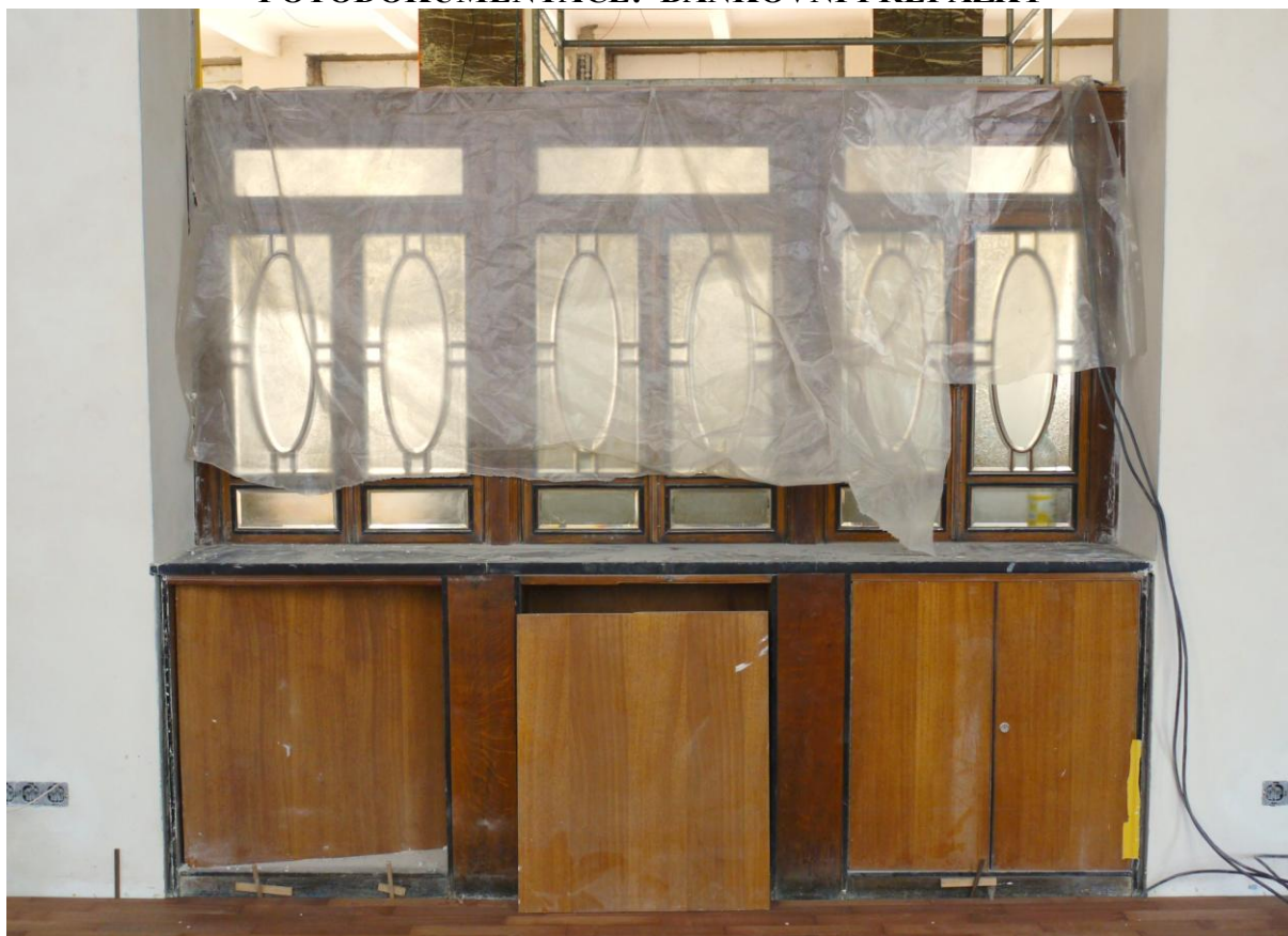
Obr. č. 1. Stav při průzkumu - bankovní přepážka - celkový pohled

Na snímku je levá /při vstupu/ bankovní přepážka ve vstupní hale /prostor 306/. Přepážka je pevná mezi dvěma sloupy. Spodní část nosné skříňky je silně poškozená, zejména dodatečnými úpravami. Povrch je silně znečištěný, povrchová úprava je dožilá. Na pravé části jsou jediná dodatečná dvoukřídlá dvířka. Všechny ostatní prostory u obou přepážek byly zaslepené. U země je soklová část silně znečištěná. Podrobnosti viz detaily.