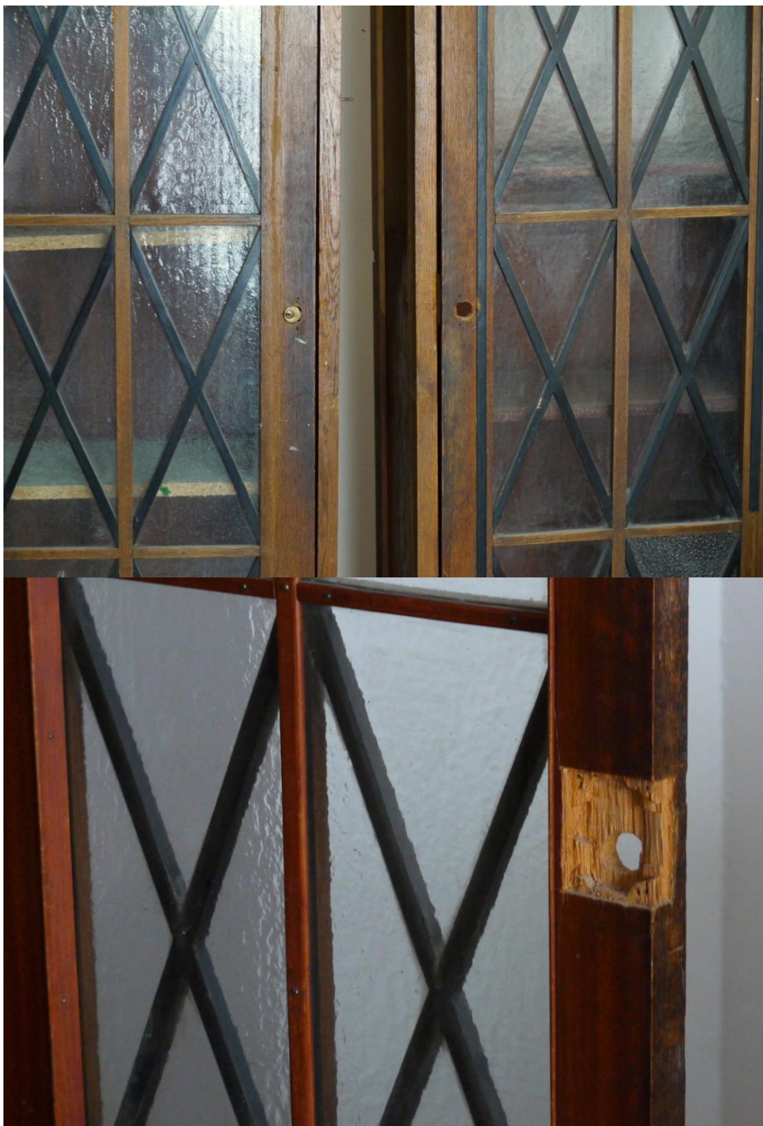
Obr. č. 20+21. Stav při průzkumu - skříň 3dílná – dveře - detail Na dveřích obou prosklených částí byly vyměněny zámky. Původní /polozapuštěné/ zámky se nedochovaly. Jeden novodobý zámek zůstal namontován. Oprava a osazení dveří určitým typem zámků závisí na požadavcích investora. Původní štítky na klíčovou díрку se nedochovaly.