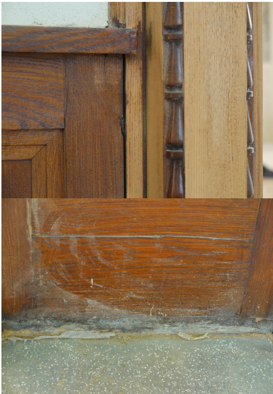
Obr. č. 10+11. Stav při průzkumu – obklad - detail

Na snímku 4 je vidět ukotvení obkladu lavičnickem ve spáře mezi obkladem a zárubní. Na snímku č. 5 je ukázka poškození spodního vlysu obkladu. Povrch je silně znečištěný a zčernalý od vody, spodní vlys je prasklý. Tato poškození se opakují i na dalších obkladech.