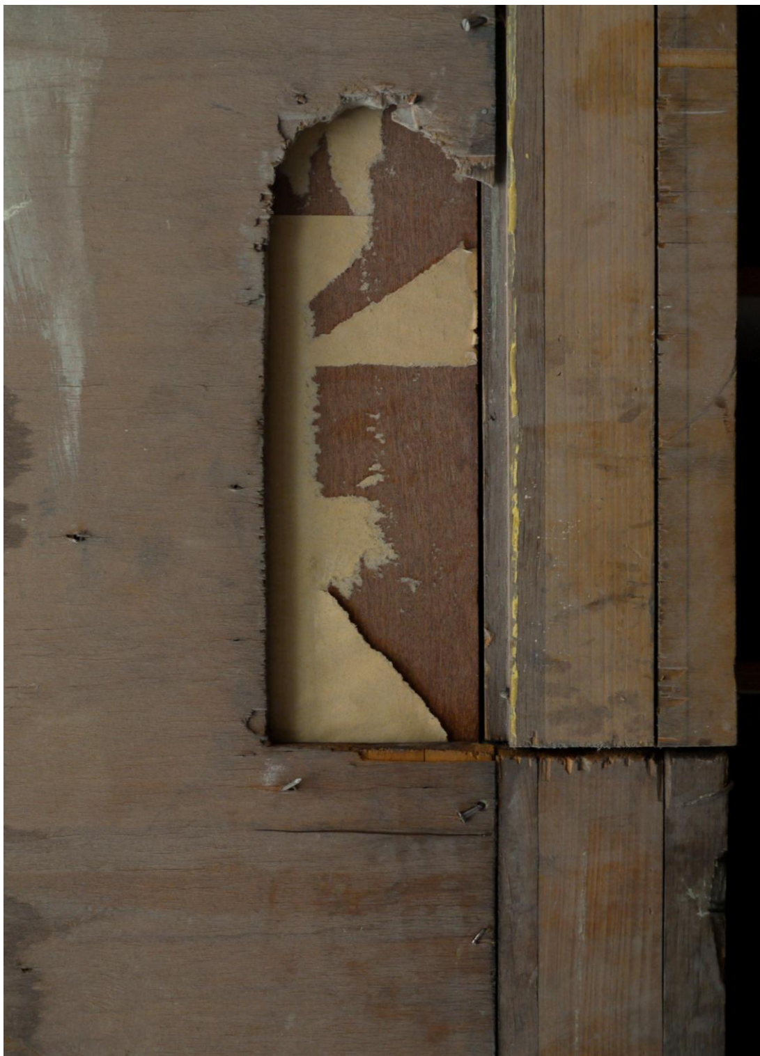
Obr. č. 4. Stav při průzkumu – obklad - detail

Na snímku je zadní strana obložení z východní stěny prostoru 507. Část poškození byla způsobena již v minulosti při úpravách /pravděpodobně/ el. vedení. S tím souvisí i rozdělení intarzované lišty na pravé straně. Toto poškození není nutné při restaurování odstraňovat. Povrch je silně znečištěný. U sejmutých částí by bylo účelné chemické ošetření zadní strany.