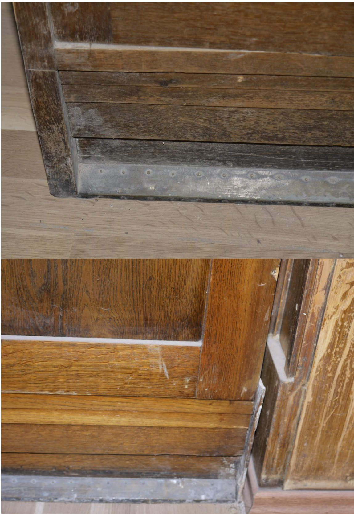
Obr. č. 5+6. Stav při průzkumu – skříň – detail – sokl skříně Sokl skříně je složen ze tří částí, stupňovitě posunutých. Spodní část je potažená plechem z barevného kovu /pravděpodobně mosaz/. Plech je uchycen řadou drobných hřebíčků. Na pravé straně je patrný zbytek začistění lištou.