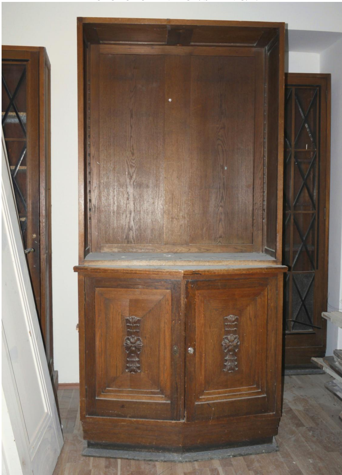
Obr. č. 17. Stav při průzkumu - skříň 3dílná - celkový pohled

Na snímku je střední část ze skříně složené ze tří částí. Boky jsou bez povrchové úpravy a mají k nim být přisazeny prosklené části v pozadí. Sokl je v dolní části potažen plechem z barevného kovu. Na skříní je řada povrchových poškození. Celá skříň je silně poškozená nevhodným používáním. Povrch skříně je silně znečištěný, laky jsou ztmavlé. Chybí police do otevřeného nástavce.