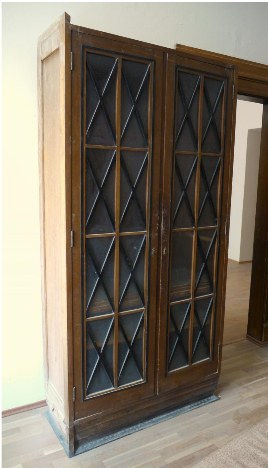
Obr. č. 1. Stav při průzkumu - skříň - celkový pohled

Na snímku je pravá polovina ze skříně složené ze dvou částí. Levý bok je bez povrchové úpravy. Lišty z vrcholu skříně jsou odtržené. Sokl je v dolní části potažen plechem z barevného kovu. Na skříně je řada povrchových poškození, chybí černé lišty. Podrobnosti viz detaily. Povrch skříně je silně znečištěný, laky jsou ztmavlé. Zámek je rozvorový, polozapuštěný, krytý lištou. Skla jsou zajištěna z vnitřní strany přišroubovanou lištou.