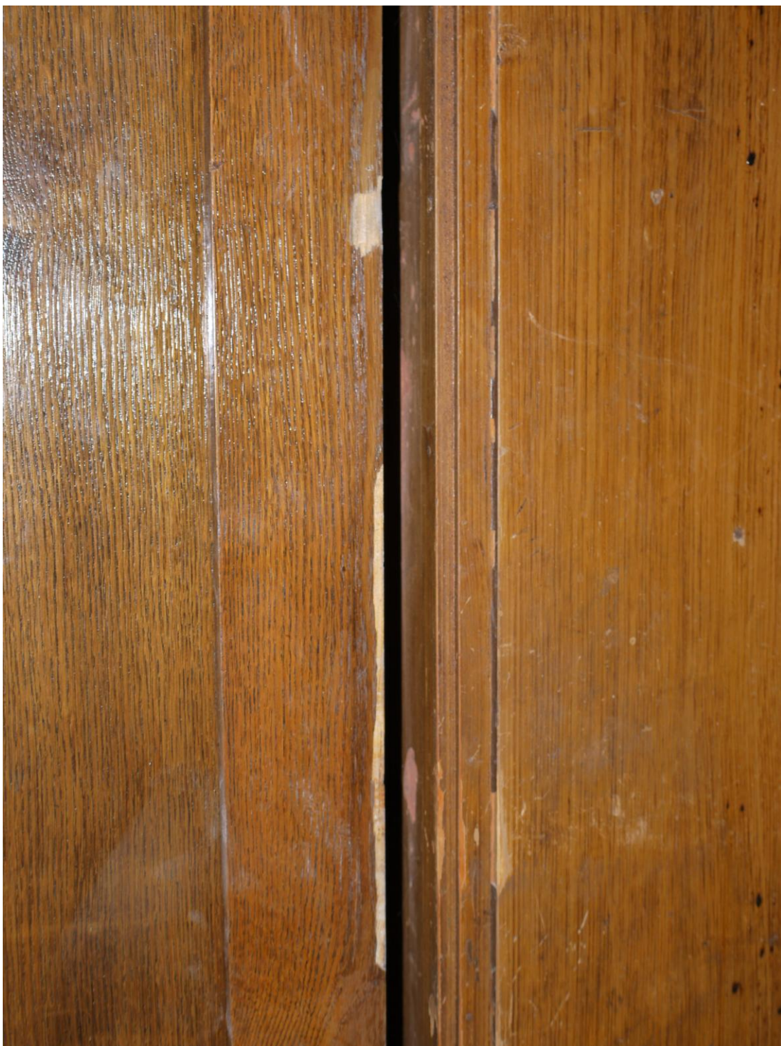
Obr. č. 8. Stav při průzkumu – skříň – detail – bok skříně Povrch skříně je silně znečištěný s řadou povrchových poškození. Na hranách jsou oštipané dýhy. V ploše jsou často dýhy uvolněné a stříškovitě se zvedají.