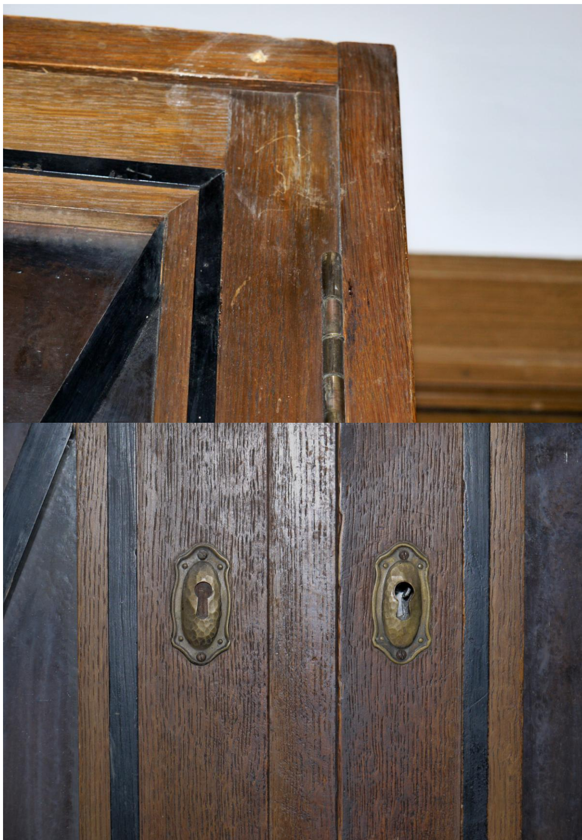
Obr. č. 9+10. Stav při průzkumu – skříň – detail – čelo skříně Povrch skříně je silně znečištěný s řadou povrchových poškození. Chybí část zdobných černých lišt. Mosazné štítky jsou dochované.