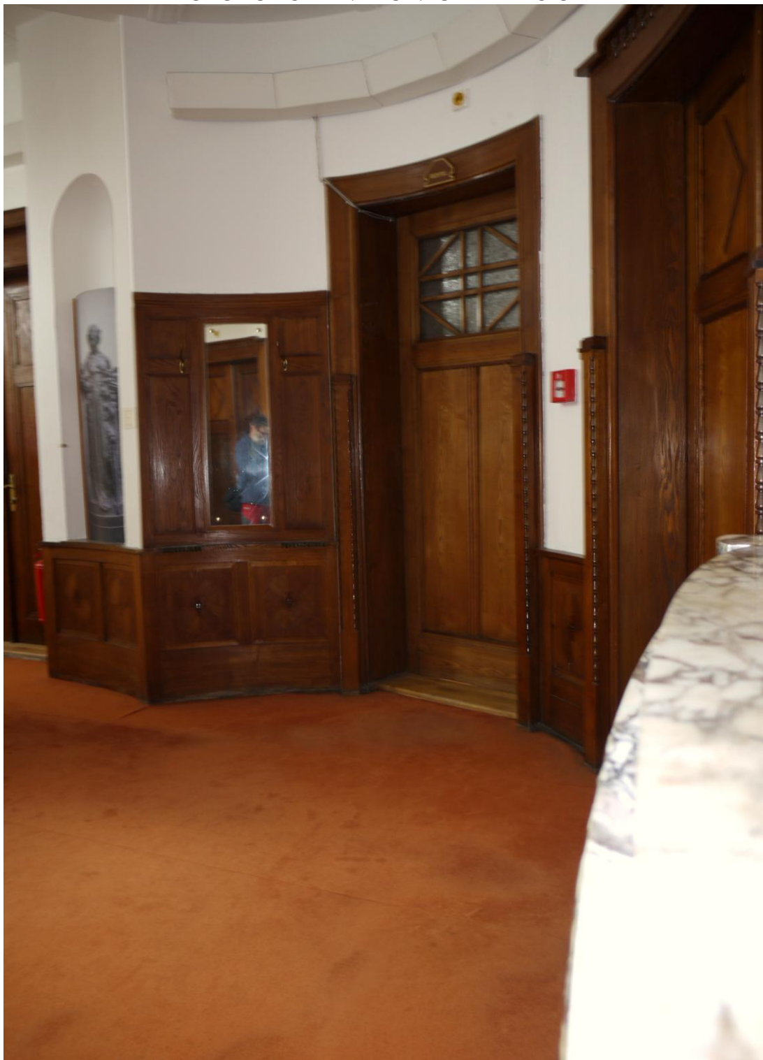
Obr. č. 1. Stav při průzkumu – obklad - celkový pohled Na snímku je vidět polovina z 6 kusů obložení /dva celé obklady a jeden poloviční/. Obložení spolu s dalšími prvky /zárubně, věšáková stěna/ tvoří jeden celek s jednotnou povrchovou úpravou. Stav věšákové stěny je totožný se stavem obkladů.