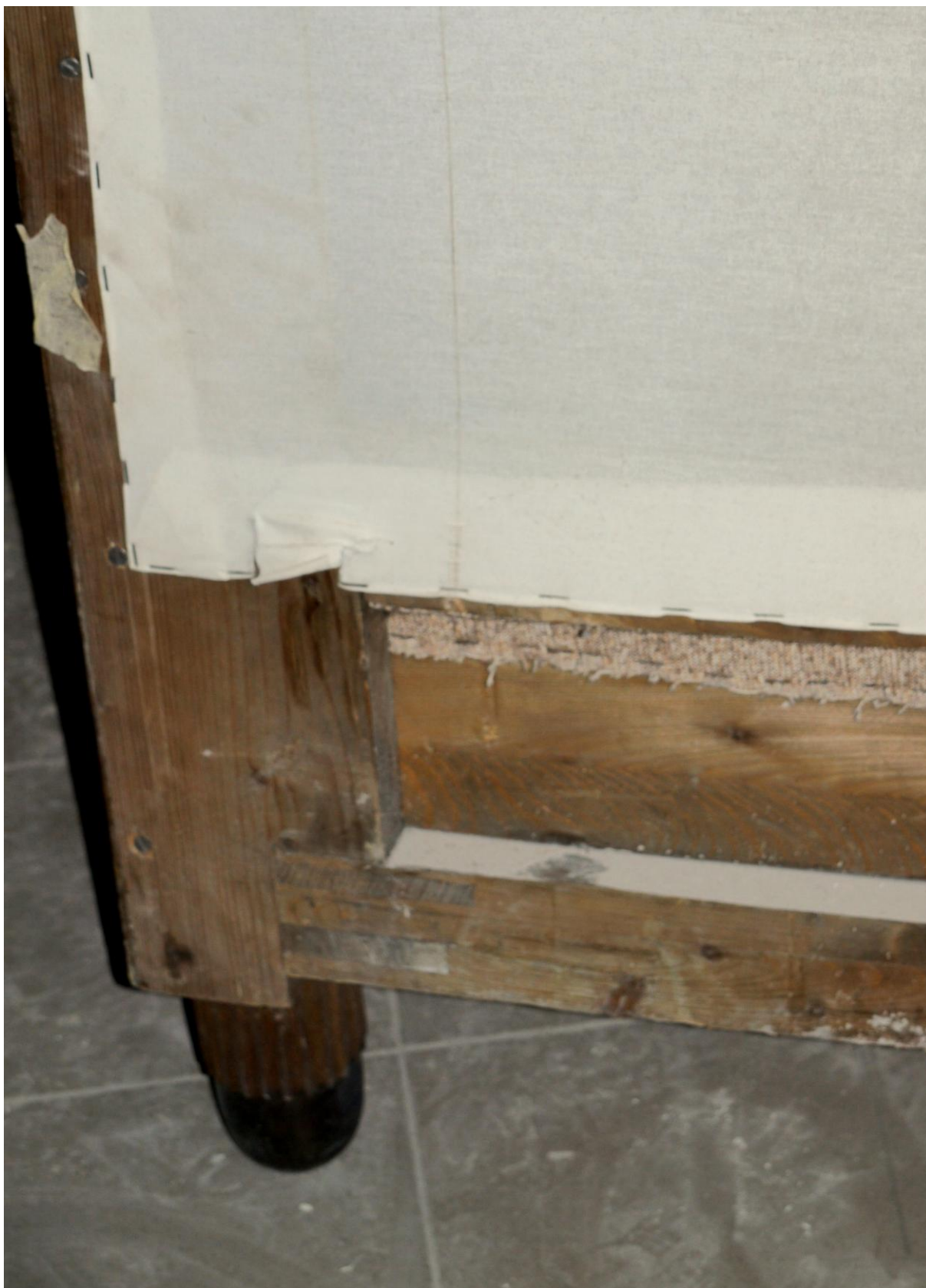
Obr. č. 4. Stav při průzkumu – pohovka - detail Na snímku je detail zad pohovky. Záda jsou překrytá bílou látkou, která je značně špinavá. Látka je upevněna sponkami. Rovněž potahová látka je upevněna sponkami. Záda jsou ke korpusu uchycena vruty.