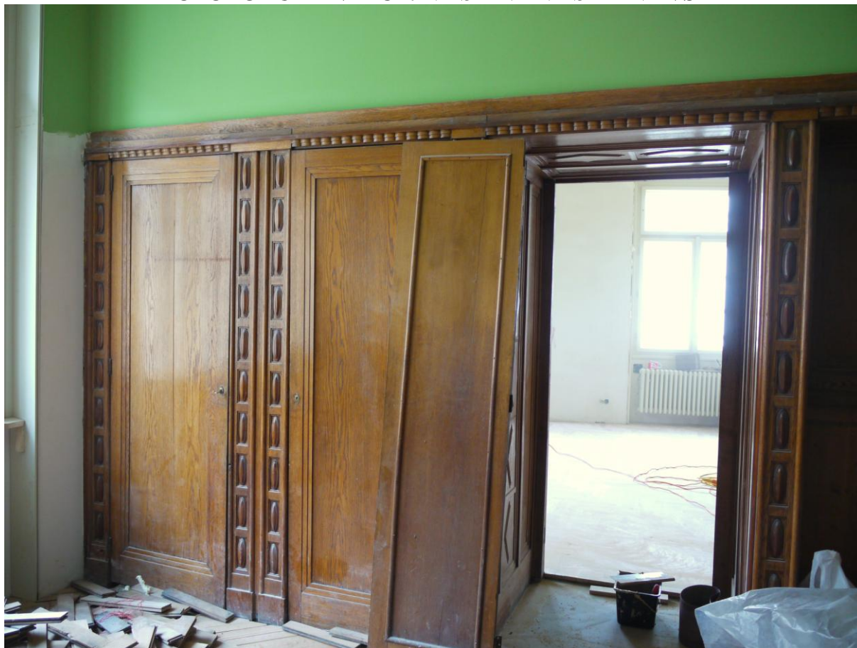
Obr. č. 1. Stav při průzkumu – vestavěná skříň – celkový pohled

Dvě vestavěné skříně mají společnou konstrukci, která je rozdělená příčkami /stěnami/ na více samostatných částí. Dveře skříní jsou panty spojeny s obkladem stěny. Povrch je silně znečištěný, s řadou drobných poškození. U země je dýhování zčernalé. U pravé skříně tvoří její bok obklad dveřního prostupu. Obklad prostupu navazuje na obklad stěn.