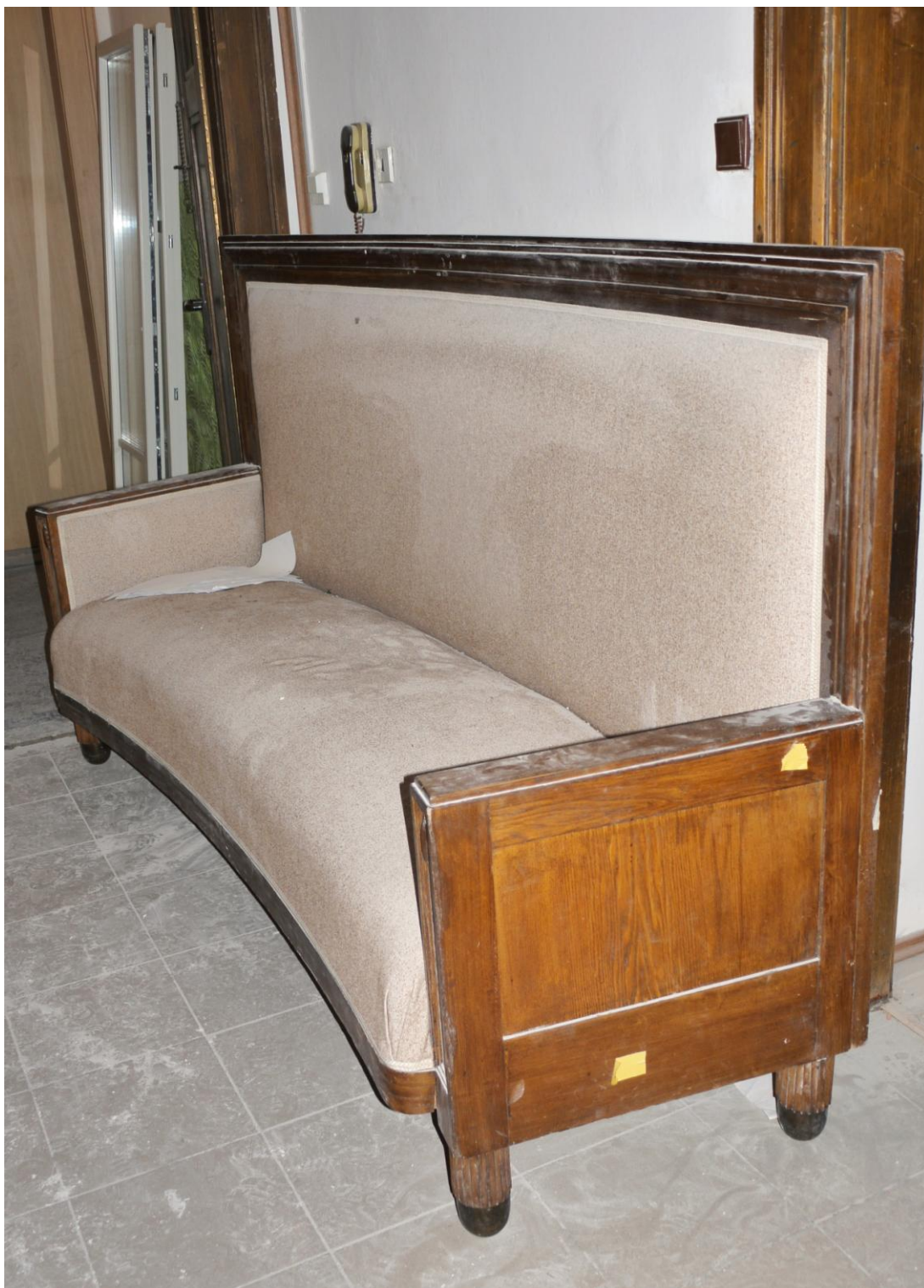
Obr. č. 1. Stav při průzkumu – pohovka - celkový pohled Na snímku je samotná pohovka. Pohovka má na nohou mosazné návleky. Mosaz je zčernalá a velmi zoxidovaná. Povrch je silně znečištěný, hrany jsou odřené.