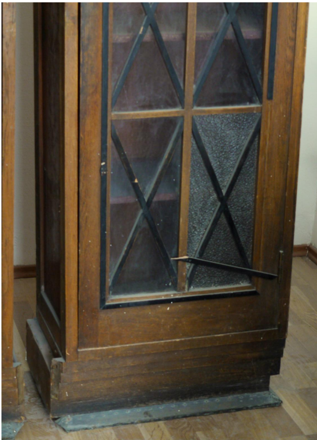
Obr. č. 19. Stav při průzkumu - skříň 3dílná - detail

Na snímku je spodní část pravé prosklené skříně složené ze tří částí. Sokl je v dolní části potažen plechem z barevného kovu. Na skříní je řada povrchových poškození, chybí černé lišty. Povrch skříně je silně znečištěný, laky jsou ztmavlé. Zámky na dveřích chybí. Skla jsou zajištěna z vnitřní strany přišroubovanou lištou. Část skel je vyměněných za skla s jiným dekorem.