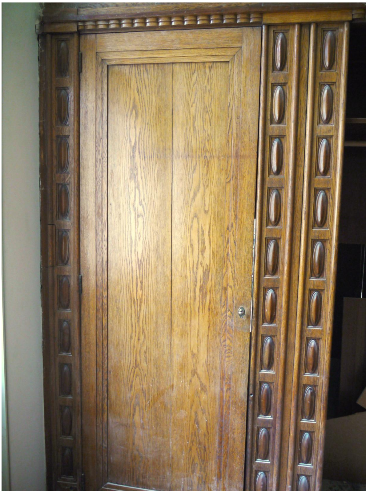
Obr. č. 4. Stav při průzkumu – vestavěná skříň /levá část/ – detail Levá skříň má rozklíženou výplň dveří. Obě poloviny výplně jsou lehce prohnuté.